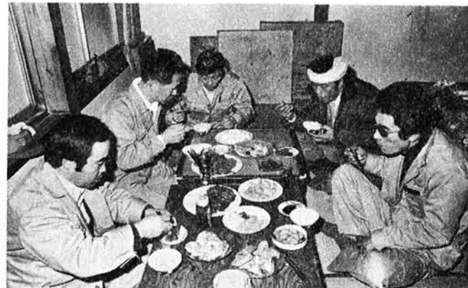
十時やつと朝食 一休みして、もう一がんばり