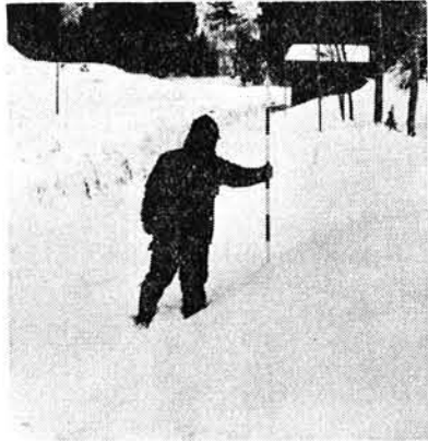
夕方4時～5時道路状況を調査