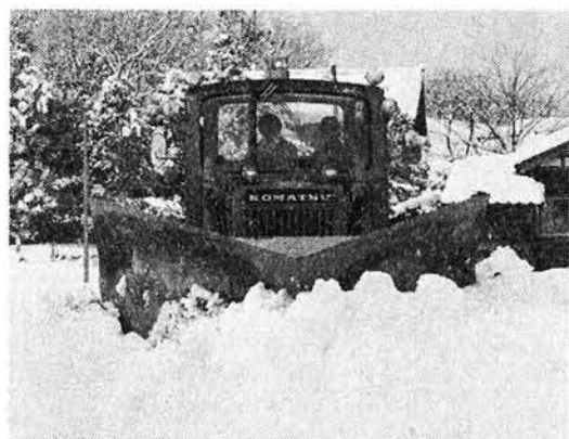
六時梅田地区、やつと明るくなった