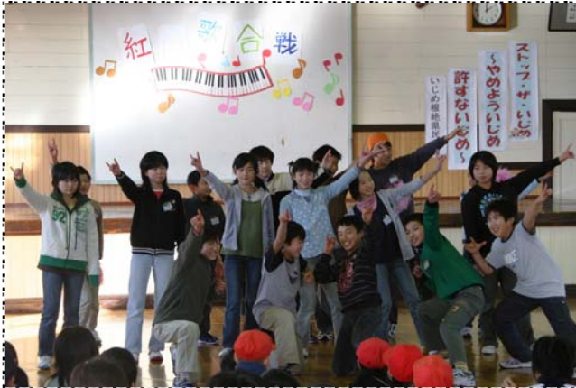
▲最後のポーズが決まったぜ！6年生(96点)