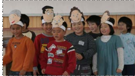
▲1年生も“サザエさん”で頑張りました！

振り付けに、先生審査員もびっくり。高得点をたたき出し、見事白組の優勝に花を咲かせました。次回は…、目指せ！NHK！！ (12月24日)