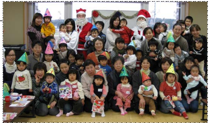
▲2人のサンタさんとハイチーズ！プレゼントはもらったかな？

子どもたちが上手に遊びに乗ってくる姿は、この1年の成長を感じさせ、嬉しいことでした。そして、子どもたちやお母さんたちの笑顔に会えたことは、主催者はもちろん参加したみんなの心を満たしてくれたに違いありません。(12月19日)