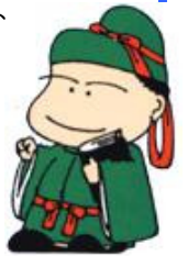
和島地域生涯学習キャラクター

講師の皆さんからアドバイスをいただきながら作り上げた作品に、一足早いお正月気分を味わいました。