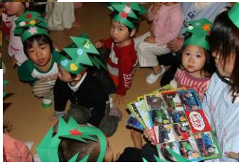
▲はまなすウィンドアンサンブル(寺泊)によるクリスマスソングのコンサート