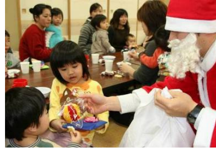
▲一人ひとりにプレゼント