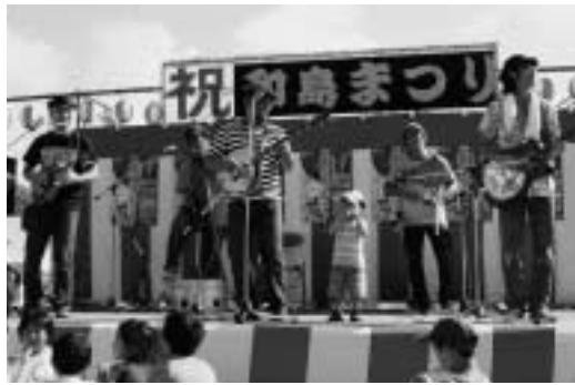
飯山ガキデカストンパーズ(長野)