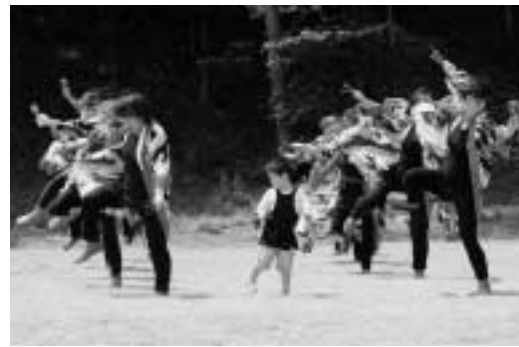
砂子塚来い来いよさこい(分水)