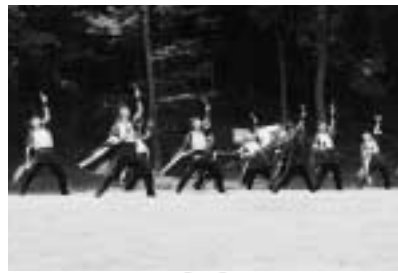
和島のチームも もちろん出演