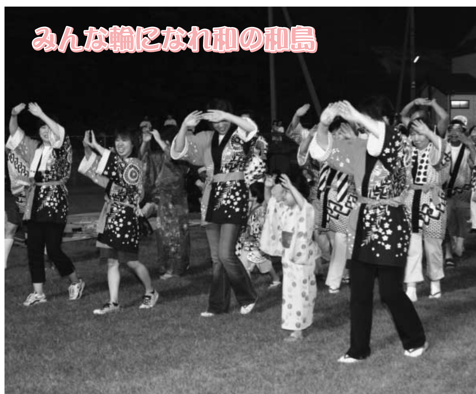
7月23日(出) わしままつり 民謡流し