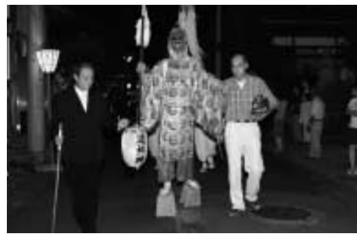
天狗様も歩きました