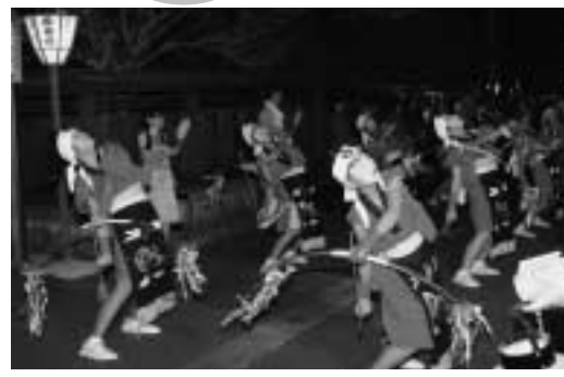
六夜祭の「弓踊り行列」