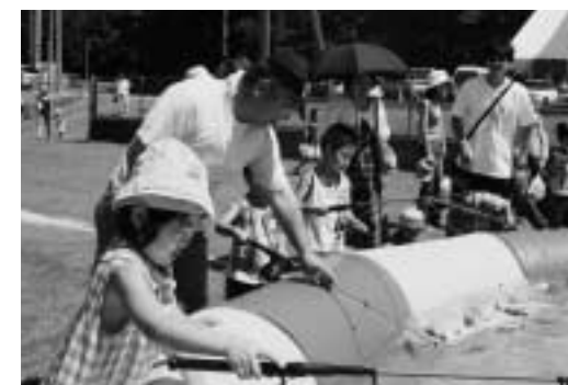
サカナはいっぱい釣れるかな