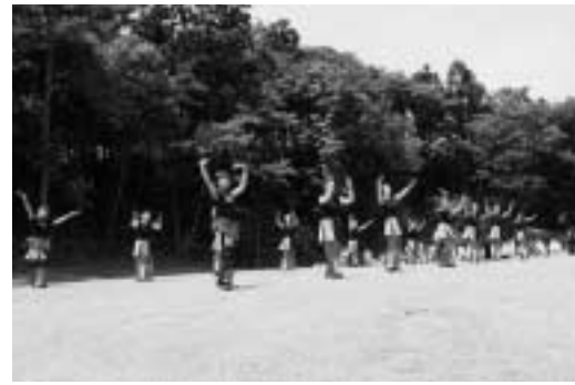
よさこい真凜(寺泊)