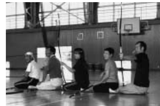
的に向かって一直線