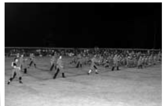
親子でいっしょに踊ります