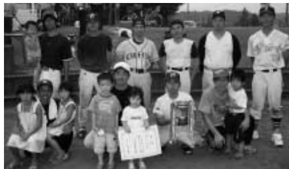
優勝した「中央」チームと応援団の皆さん