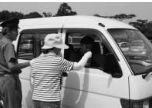
安全の意識を忘れずに