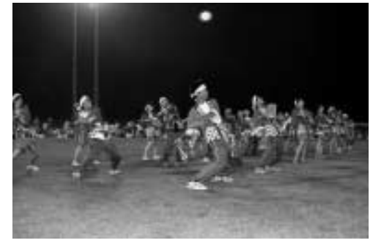
大きくそって堂々と