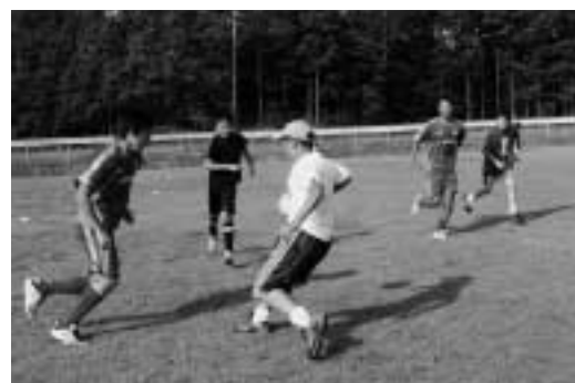
選手と一緒にミニゲーム