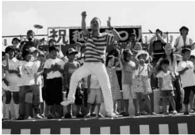
澤村のおっちゃん みんなでゾー —— さんだゾ(兵庫)