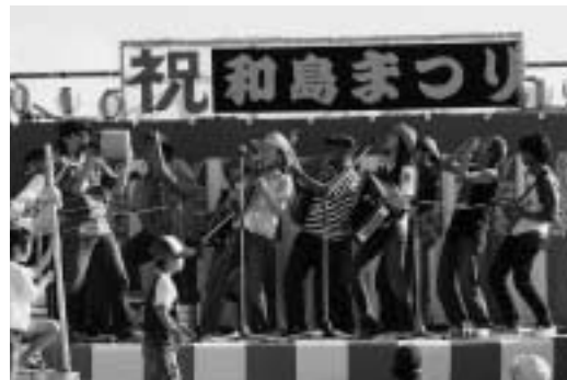
HOTCH-POTCH JUG BAND(宮城)