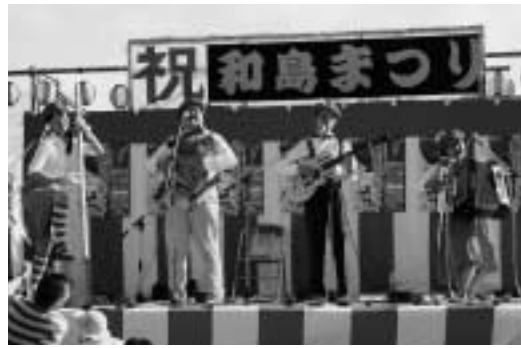
東京おかわりボーイズ(東京)