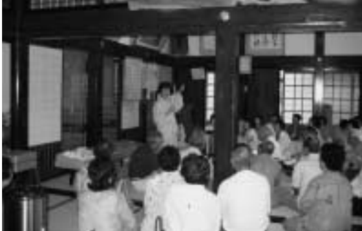
村外研修 開興寺の説明

8月18日(木)は長岡市立消費生活センターより講師を招き「悪質商法にだまされないで」というテーマで講演をいただきました。新しい手口でせまりくる悪質な商法に対処できる知識を教えてもらい有意義な時間を過ごしました。