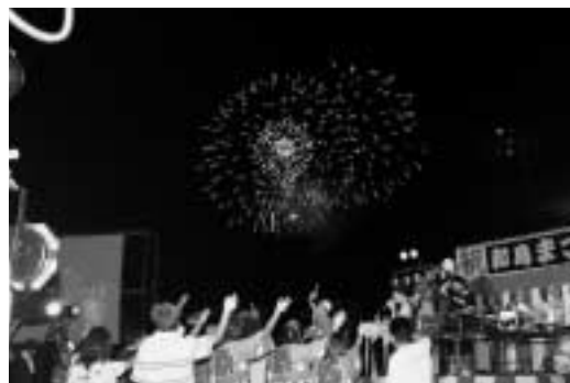
花火と音楽の共演