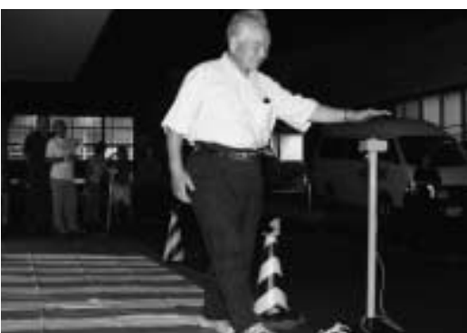
横断には余裕をもって