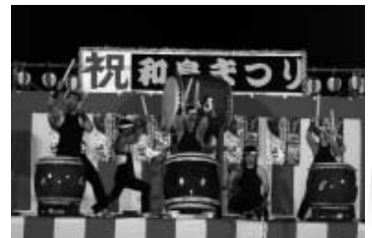
体に響く太鼓の音(燕市)