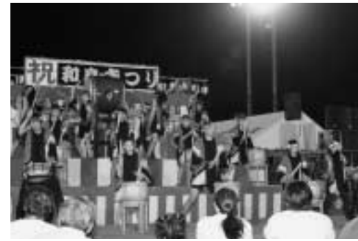
力強く太鼓の競演 わしま太鼓初舞台