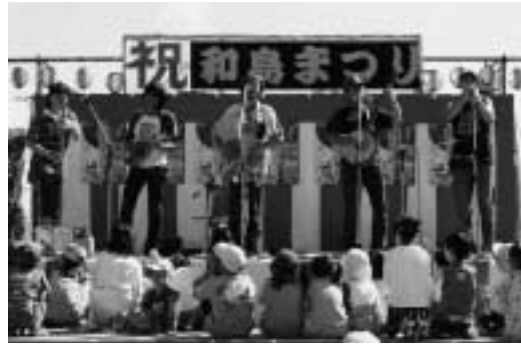
Kechon Kechon Jug Band(山形)