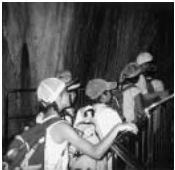
チョット冒険気分

2日目 創作活動のはがき書き後、青年の家周辺を散策し、魚のつかみ取りをしました。子供達は魚を捕まえる方法を考えながら夢中になっていました。夜は、ミステリーウオーク(肝試し)を実施しました。