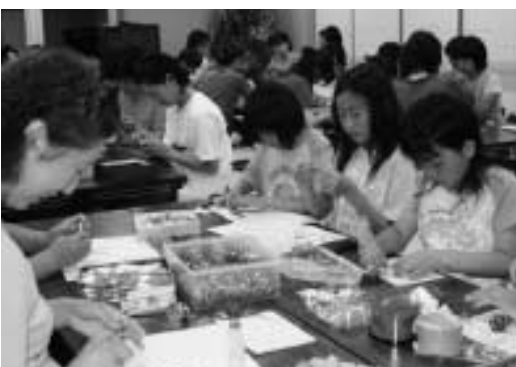
一つ一つ心を込めて