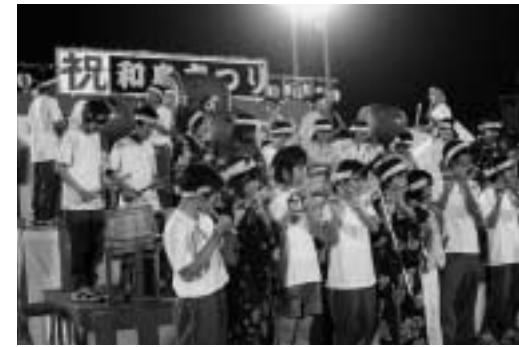
中学生自ら演奏します