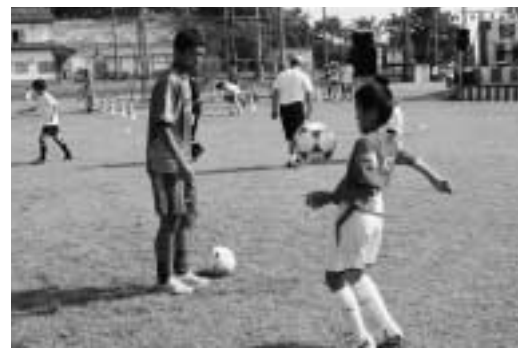
リフティング指導