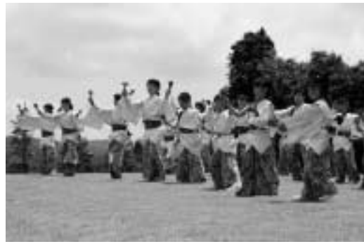
ソーランWAVE寺泊(寺泊)