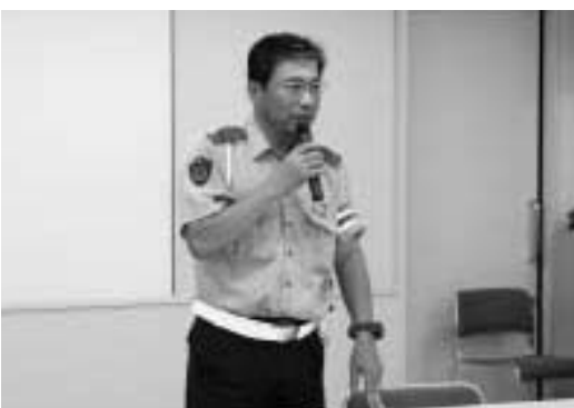
秦野交通課長の講話