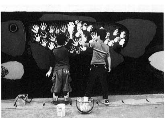
◀つるこはボクの手

長岡造形大学の4年生らがメイン講師として、地域のみなさんや役員職員ボランティアと協力し指導にあたり、子どもたちと一緒に