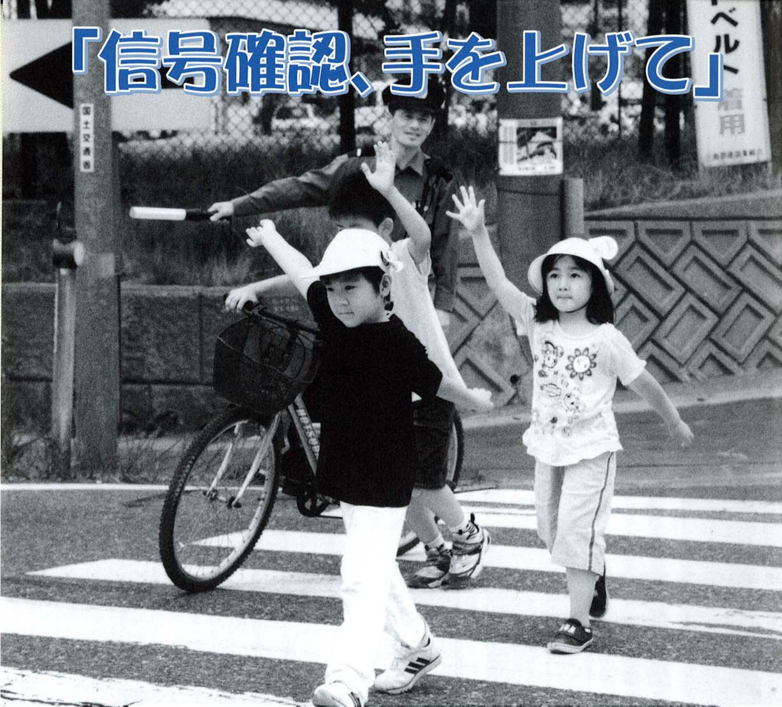
6月20日 桐島小学校交通安全教室より