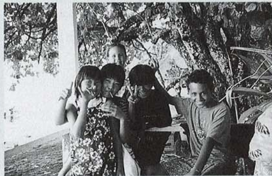
▲平成11年は4名の小学生が参加し、有意義な経験をしました。