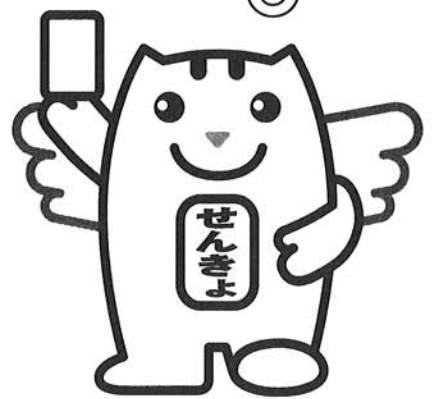
明るい選挙のイメージキャラクター 選挙のめいすいくん 「みんなの一票 大切に！」