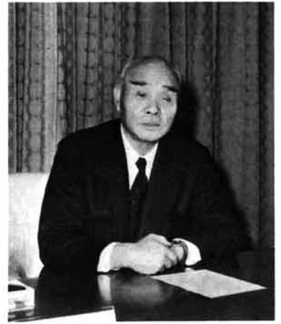
栃尾市長 渡辺 芳夫