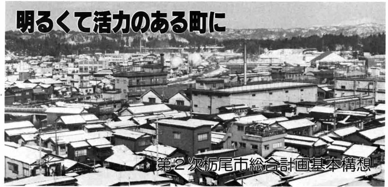
第2次栃尾市総合計画基本構想