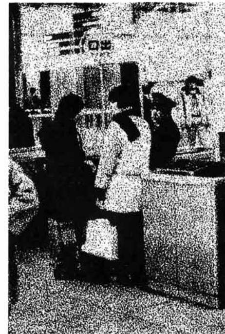
昨年、凶悪犯や窃盗など刑法犯上の罪を犯して補導された少年は、全国で約13万7千人を数え、前年に比べ1万8千人(15%)もふえています。また、この中の約7割が中学・高校生です。