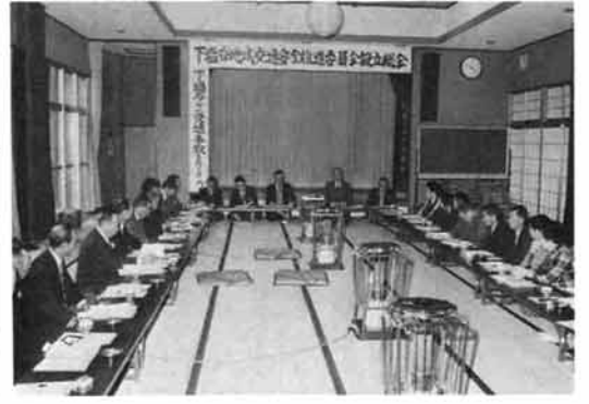
下塩谷地域交通安全推進委員会設立総会(12月22日)