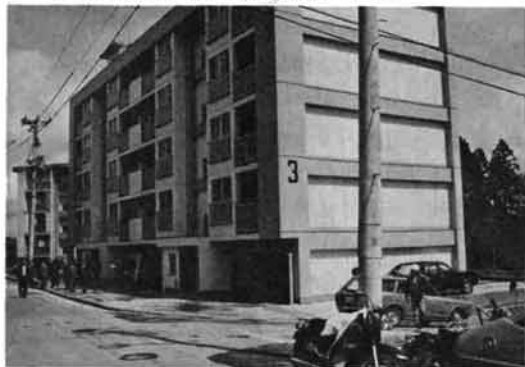
上の原市営住宅 三棟目が完成

昨年9月から1億1,300万円で工事を進めていた、上の原市営住宅の3棟目が完成し、さる4月28日竣工式を行いました。 1戸の間どりは、6畳が2室、4.5畳が1室に台所、風呂場、便所付です。