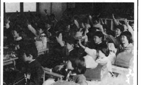
481人が小学校へ入学

栃尾東小学校では、さる4月5日入学式を行いました。ことし入学した児童152人(男73人、女79人)は、元気にはしゃいでいました。なお、このほかの学校に入学した児童は、329人(男170人、女159人)です。