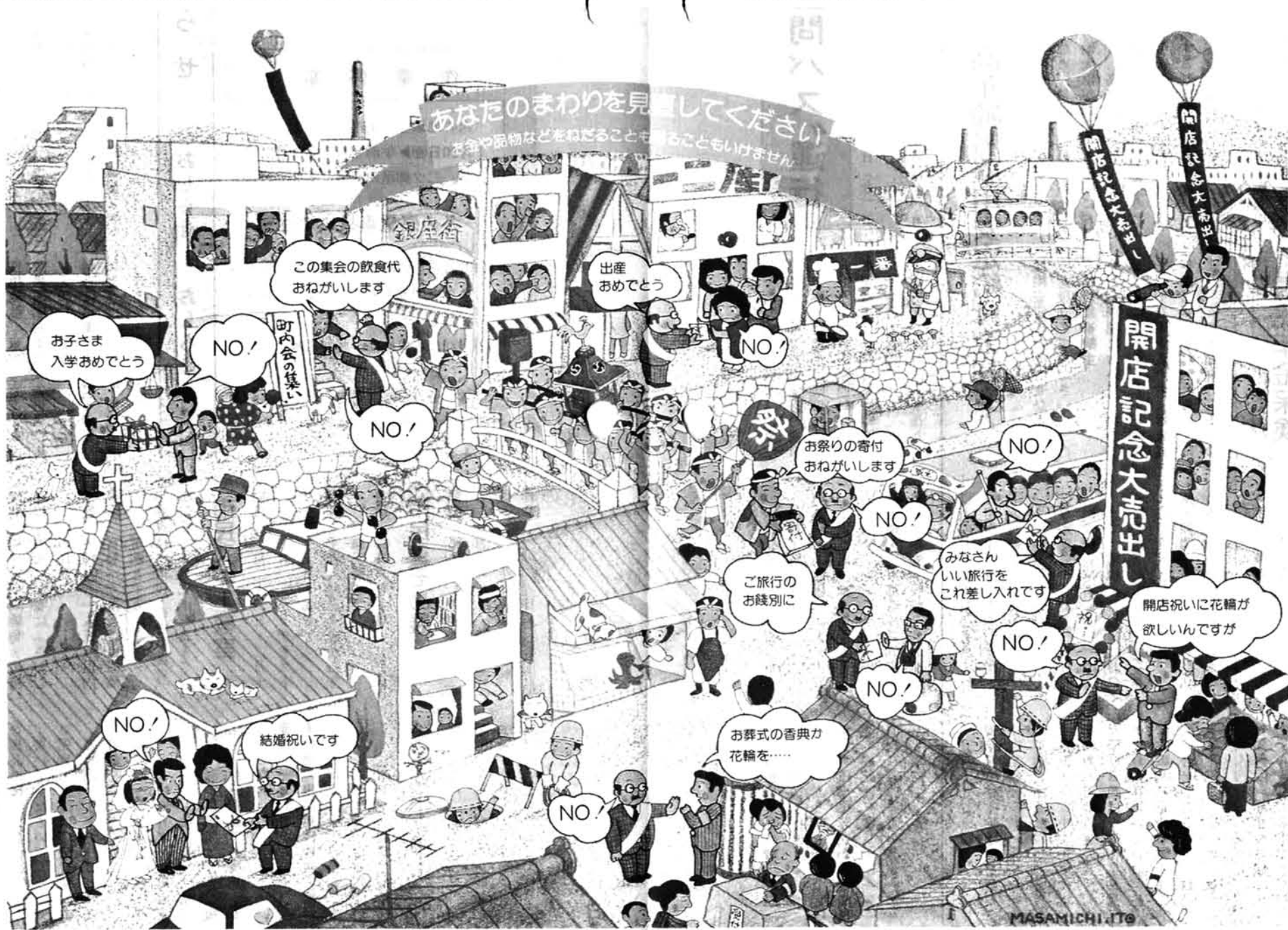
後援団体や国・地方公共団