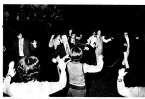
将来も理想的には、「週末は夫婦でダンスを」として、「日中は田んぼで田植えを、夜はスーツとネクタイでダンスを」というくらいにまでダンスを普及できれば、というのが会員の願いです。