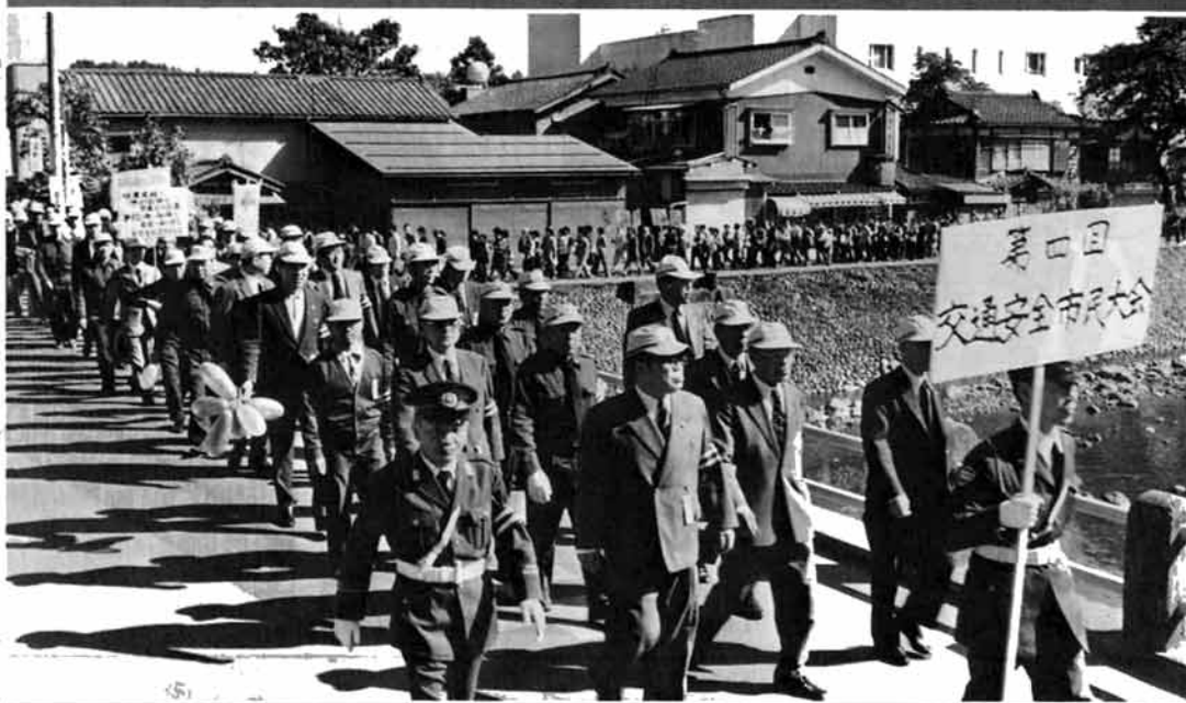
誓いも新たに第4回栃尾市交通安全市民大会 関連記事8ページ