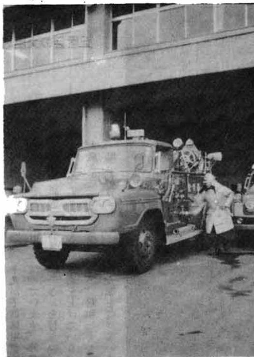
サアツ、出動……一秒で、早、現場へ

だま外出するようなことは「魔の手」を呼んでいるようなもの。特に天ぷらを揚げている時に来客 のまま外出するようないことは「魔の手」を呼んでいるようなもの。特に天ぷらを揚げている時に来客 だま外出するようないことは「魔の手」を呼んでいるようなもの。特に天ぷらを揚げている時に来客 だま外出するようないことは「魔の手」を呼んでいるようなもの。特に天ぷらを揚げている時に来客