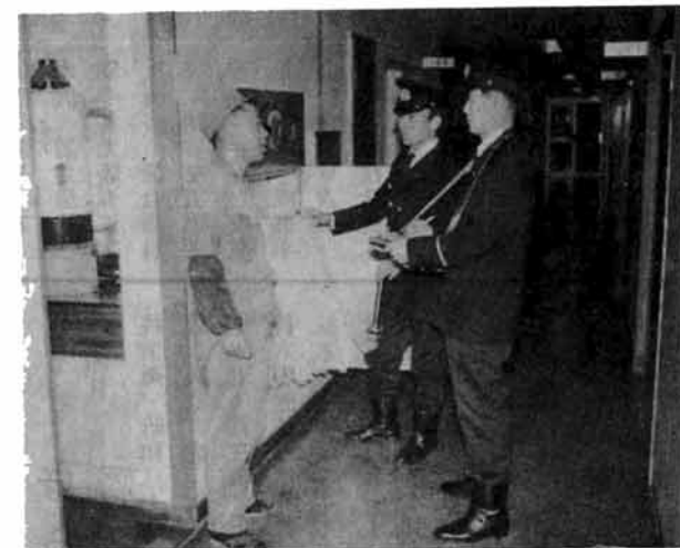
写真上 消火栓も非常時に備え定期的に水圧などの点検を行なっています。写真下 一般家庭への防火査察と工場などの事業所には厳しく査察指導し、事故の未然防止に努めています。