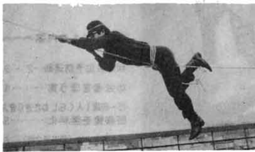
写真上 消防用の水利点検、放水の具合など常に整備しています。写真下 中高層ビルの火災に備えレンジャー訓練。