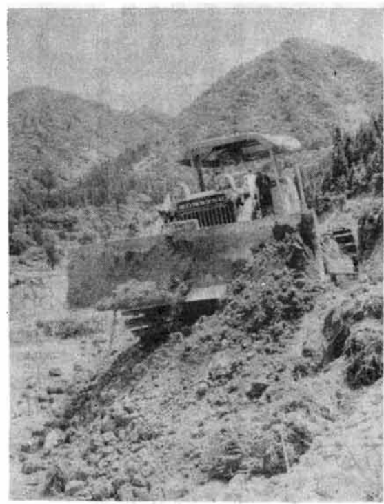
始まったダム資材輸送道路(布滝下流左岸) 後方左上にダムサイト

劉谷田川流域市町村の悲願であつた多目的ダム劉谷田川ダムは、五十三年完成を目標に、いよいよ来年度着工されることになり、このほど資材輸送道路の起工式が、橋堀の守門橋上手現地でなされました。 劉谷田川は、長さ約五十キロメートルの信濃川水系の一級河川ですが流域には増水すると自然排水