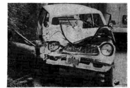
ちよつとのゆだんがこんな大惨事に……

飲酒運転の追放 最近また飲酒運転がふえています。とくに八月は蒸暑など飲酒の機会が多くなります。 車を運転してきた人には酒を飲ませない。また酒を飲んだ場合は鍵をあげて運転をさせないでください。 飲酒運転は、大きな事故につながります。 安全運転の確保 例年八月は海水浴等のレジャーや帰省のため交通量が多くなり、これに比例して交通事故もふえています。 毎朝家を出る前に、交通安全についてひと言葉をかけ合う習慣をつけましょう。