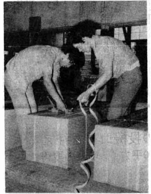
輸出向けはダンボールにきちんと入れられる