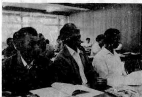
〔熱心に話を聞いた後、質問をする各リーダー〕

ことしの出かせぎに先だち、梶尾市役所、梶尾保健所、長岡公共職業安定所、中越農政事務所は、さる九月二十二日市役所に出かせぎリーダー会議を行ないました。集まったリーダーは五十五人、早い人では十月 の下旬になると、多い人で五十人の仲間とともに、ことしも約一千人のかたが関東、関西、東海地方へ出かけます。帰郷するのが来年の四月下旬ころ。 出かせぎする家庭の心配は、「おとうさんの健康」です。また出かせぎ者は、妻や子ども、雪の仕末など心配は数えきれません。しかし、このような心配を少なくしよう