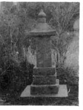
〔森立峠の見送り地藏〕

さりげなく道ばたに立っているお地藏様、すでに使命を失って見向きもされず、ただ風雨に晒されるままに風化し、磨滅してゆく庚申塔でも信仰的に、文化史的には高い価値をもっています。 支那や朝鮮のものは古く、日本にも豪華なもの古く、また芸術的に勝れているものが沢山あります。奈良県桜井市の近くに、ある石位寺の薬師三尊は大きな石に真中に薬師、両脇に菩薩がおります。中尊の薬師は腰をかけているお姿で、高さ三尺七寸です。腰をかけている姿、彫りの具合など東京の深大寺の釈迦仏を連想させます。所謂白鳳物で今から千三百年も前のものです。石には金仏と違つた柔かい美しさがあります。また室生口大