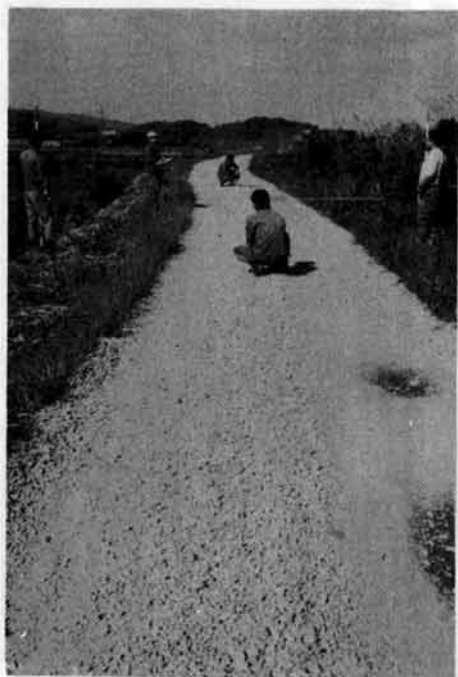
〔市道をくまなく調査する係員〕

四月以来進めている市道の現況調査は、順調に作業が進み、さる六月市議会に引きつづき、調査完了の二九〇路線二万一千メートルを今議会で市道に認定しました。再編成後の市道は、六月市議会認定された五八路線二万一千メートルを合すると三万二千メートルになります。しかし、旧町部の調査を残しているためまだ伸びます。しかし、編成後は、編成前の八八万二千メートルを半程度減らすことが予想されます。 この現況調査は、十二月までに旧町部と村部調査済み地域の調査