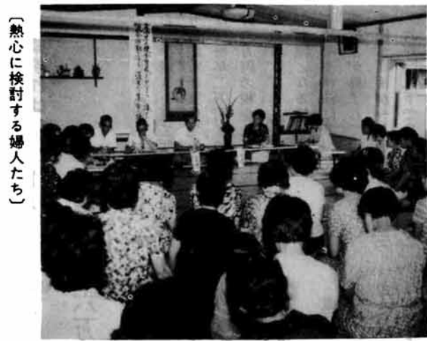
〔熱心に検討する婦人たち〕

◎：現在、婦人の大部分は、職業をもっているうえ、役員になると婦人会の会議の準備、事業実施の準備などの仕事があり、家庭の仕事を圧迫するため、役員になりてが少ない。 ◎：集会への出席者が少ないが、その原因として①主人や年寄の前を気にしている②仕事をや家事の都合がある③会場と時間の関係が婦人の出かけるとき、都合が悪い時間帯がある