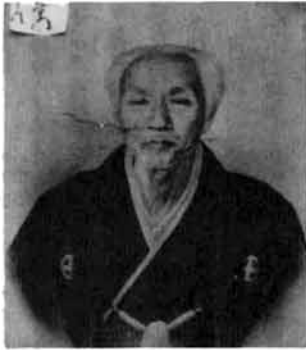
(二代目 川上八郎右エ門)