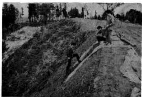
(城山の頂上、右側が補修所)

春の行楽シーズンをむかえ、これから天候に恵まれた休日には、家族連れなどで城山ハイキングをお楽しみください。 みなさんご承知のとおり、城山は県の文化財に指定されていますから、利用された場合は、空びん缶から、紙屑などの、あと始末をよくして、いつもきれいにしておくようご協力ください。 なお、昨年来、城山頂上の一部