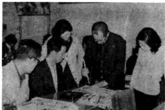
(先生の筆使いを熱心に 見つめる受講生)

分が崩れたため補修しましたが、この部分に立ち入ることは、たいせつな史跡を損壊するばかりかたいへん危険です。補修所には絶対はいらないでください。