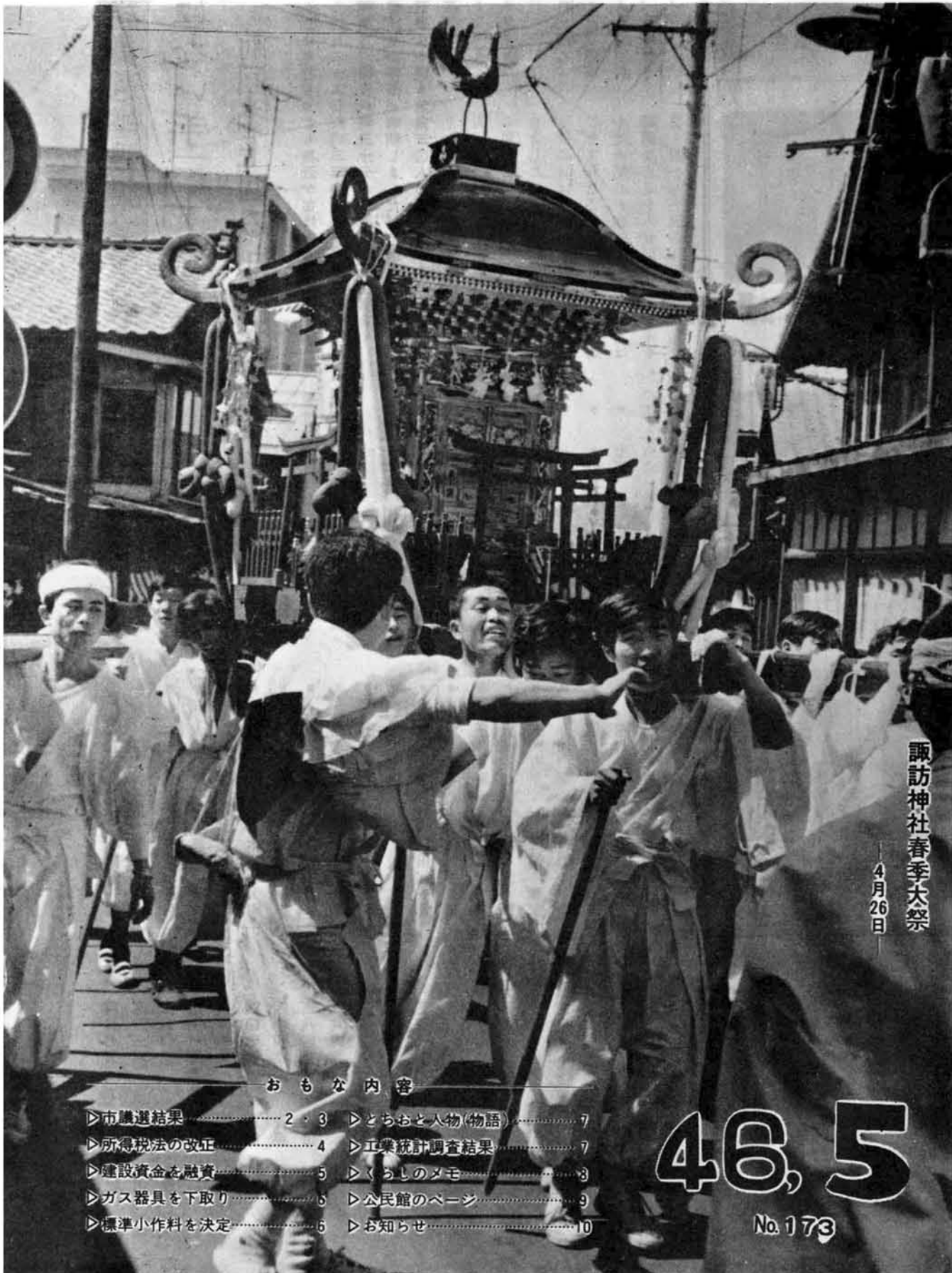
諏訪神社春季大祭 4月26日

ちお第一七三号昭和四十六年五月十日発行 一月十日一回発行(定価一部四円) 昭和三十一年一月二十日第三種郵便物認可