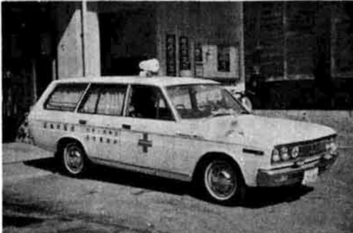
(新サイレンの取り付けが完了した救急車)

五月二十日から救急車のサイレンが、いままでのモーター式からソフトな音の「ビーボー」式に変わります。 救急車の出動は、交通事故などの激増により年々ふえる一方で、昨年度市内の出動件数は二七三件に達しています。 市街地は道路がせまいため、車の増加で渋滞になりがちですが、ビーボーの音を聞いた車は、救急車がスムーズに通れるよう道路左側によけるようにお願いします。