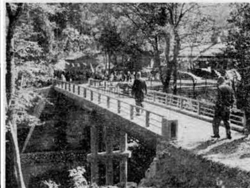
【写真は、できあがった森上橋】

森上橋が完成 この森上橋は、株式会社小森組によって工事が進められておりましたが、さる十月十日に完了したもので、全長一八メートル四センチ、有効幅員二メートル五センチの永久橋で、工費は二四〇万円でした。