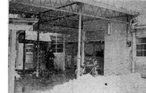
【写真説明】 上は増築庁舎の入口、中は一階窓口、下は新しい事務室での執務中

増築中の市庁舎が、新年からこの増築庁舎で執務しております。したがって、今まで旧庁舎中学校跡に分室を作っておりましたが、これを全部解消して増築庁舎に移転しました。これで教育委員会事務局関係を除いた各課がひと所にまとまったわけです。今までいろいろの用件でおいでになる皆さんにたいへんご不便をおかけしていましたが、分室をなくし、同一区画内に収容できたことで、今までの不便がかなり解消されたわけですから、どうか、いろいろな設備が満足すべき状態でありませんが、除々に新設改善して市民の皆さんのサービスに努めるよう研究してまいります。