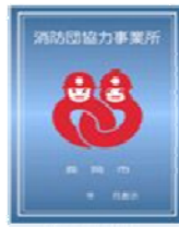
消防団協力事業所表示証

長岡市では消防団活動や団員の確保に貢献し、地域防災力の充実強化に寄与している事業所を「消防団協力事業所」として認定しています。栃尾地域からは次の9事業所が認定されています。