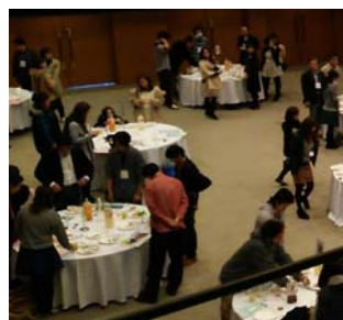
▲②とちコン2014の会場の様子(11月30日)