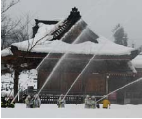
▲前回の様子(秋葉神社)

文化財防火デーに伴い、消防団、消防署部隊による消防訓練を行います。 と き 1月25日(日) 午前9時～10時 と ころ 華蔵院(上塩) 問 合 せ 栃尾消防署 ☎52-11155