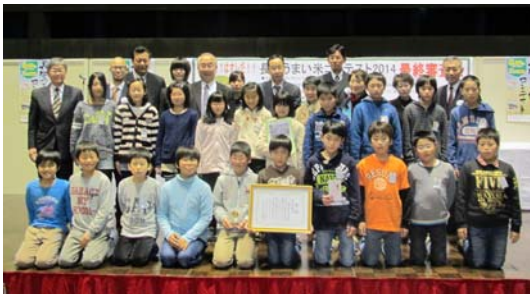
▲表彰を受ける東谷小学校5年生のみなさん(11月29日)