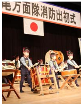
▲幼年消防クラブ演技

内 容 ①式典 午前9時15分 ②幼年消防クラブ演技披露(芳香稚草園) 午前10時30分 ③祝賀放水(市民会館前西谷川) 午前10時45分