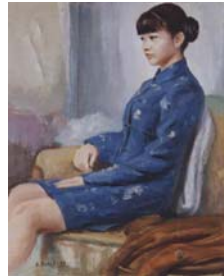
▲チャイナドレスの女