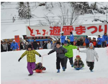
▲とちお遊雪まつりが道の 駅 R290 とちおで開催され、来場 者は巨大すべり台やシルラリ ー、雪上ソリーレースを楽しん でいました。(2 月 12 日)