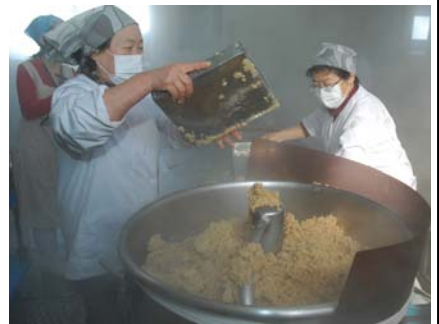
▲素材にこだわった手づく りみそを生産している「とちお みそ工房」で栃尾産大豆を使っ たみその仕込みが最盛期を迎え ていました。(2 月 22 日)