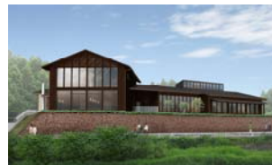
▲施設の外觀イメージ