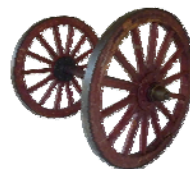
▲消防ポンプの車輪