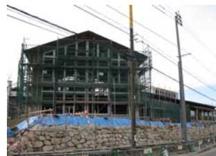
▲工事中の温泉利用施設