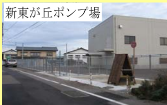
新東が丘ポンプ場