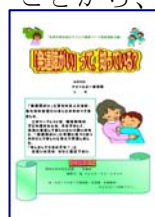
▲「発達障がい」 のリーフレット