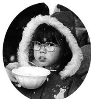
ご馳走で体を温めました

ていました。また、今年はバルーン教室(風船細工)も行われ、鮮やかな手つきで風船を動物の形などにしていました。栃尾のご馳走を楽しむ味自慢市では、粟もちやあぶら揚げ、地酒、笹だんご、赤飯などが販売されました。当日は、雪の舞う寒い一日でしたが、会場を訪れた人たちは、カモ汁やキムチ汁、うどん、昨年も参加してくれた出雲崎町のたら汁を買い求め、おいしさを楽しみながら体を温めていました。