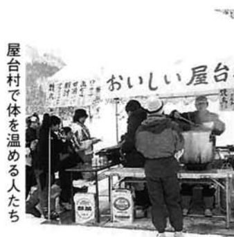
屋台村で体を温める人たち

あいにく時折雨が降る天候でしたが、ゲレンデは親子連れなど七百人のお客でにぎわい、屋台村の豚汁や焼き鳥、甘酒は売り切れになるほどでした。