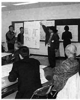
グループで出た話題を発表

関心のある市民ならだれでも参加できます。特に子ども・青年層の多数の参加をお待ちしています。