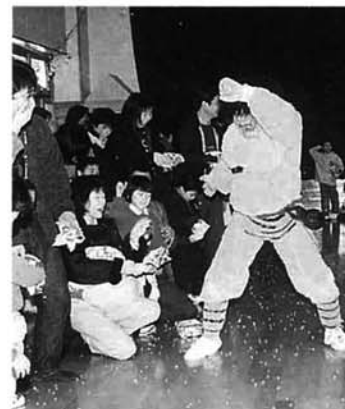
本成寺鬼踊り奉賛会による本格的な鬼を、豆をまいて退治

三条市の本成寺鬼踊りは、日本三大鬼踊りの一つ。この鬼踊りが、みどり保育園で行われました。怖がっていた園児たちは、豆まきが始まると、赤・青・黄・緑・黒の五匹の鬼をめぐり、元気に豆をまきました。