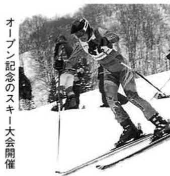
オープン記念のスキー大会開催

午前十時から、スキー場オープン記念第五十回市民スキー大会(栃尾市スキー協会主催)が行われました。出場したおよそ五十人の選手は、二回の回転競技でタイムを競いました。また、正午からはゲレンデ脇