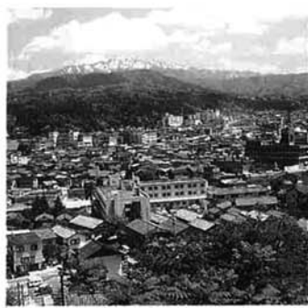
素晴らしい栃尾の自然

私は、栃尾の素晴らしい自然に触れ、この姿をいつまでも大切に守っていきたくと思っています。「きれいな水・土・空気」こんな当たり前のものが、貴重になってきたのが現代の生活です。当たり前の「栃尾」の姿を次の世代に引き継ぎたいものです。