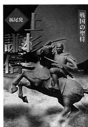
2,000冊作成された謙信公読本。うち800冊は市に寄付され、小中学校に配布します。

栃尾謙信公奉賛会は、この度郷土の英雄、上杉謙信についてまとめた小冊子「聖将・上杉謙信」を発行しました。これは、一昨年の謙信公祭三十周年を記念して企画されたもので、市内の小中学校などに配付される予定です。