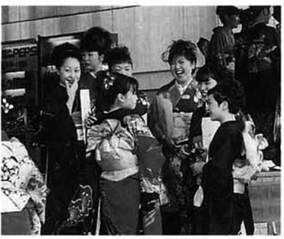
昨年行われた成人式の様子