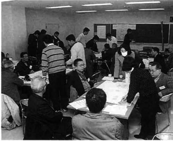
市民整備 ワークショップで提案された意見は、市に親しまれる河川敷公園になるよう、計画に生かされます。

ゲーム形式で自己紹介をしたあと、五〜六人づつ六つの班に分かれて作業を開始しました。