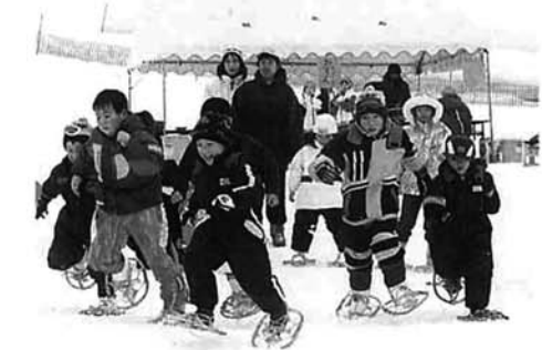
雪上レク大会でかんじきレース

の広場で、幼児や小学生などを対象にした雪上お楽しみゲーム大会。雪に埋まったカードを探す宝探し、かんじきをはいて雪原を一周するかんじきレース、雪積み、雪の当てるなどで雪遊びを楽しみました。