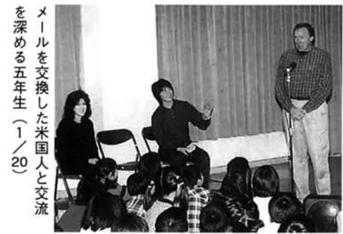
メールを交換した米国人と交流を深める五年生(1/20)

インターネットを使い、地球の視野から環境教育を進めている、ワールドスクールジャパン実行委員会から大賞が贈られました。栃尾東小学校は「農業と食生活」について、インターネットを通じて食料フォーラムや外国とメールのやりとりをして学習や活動をしてきました。