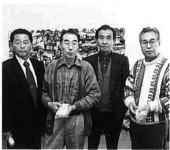
「夢しお21」のお世話役、事務局のみなさん

これまで、山間地の自然を生かした特産物で活性化できないかと、農業改良普及センターなどの指導で、勉強会や視察研修を進め