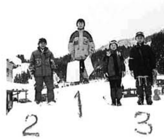
雪でつくった表彰台で入賞をよるこぶ