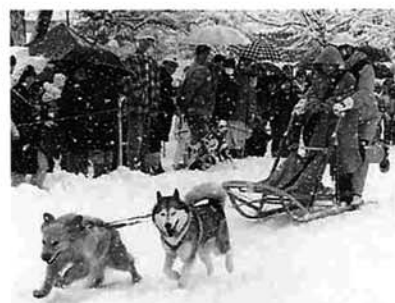
雪の中でも子どもと犬は元気です