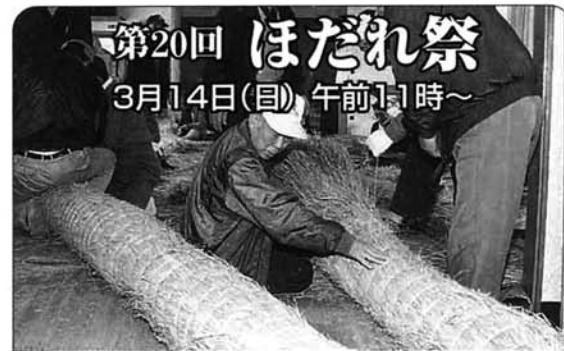
200kgの大しめ縄づくり(2/7)

画集サイン会 会期中の土・日・祝日、12時～16時30分 □花のカルチャープラザ と き ▽季節のリース、ナチュラルリース：3月20日・21日・22日▽押し花でつくる小物：3月13日・14日・27日・28日 10時～12時、13時～15時 ところ 鑑賞温室内 花のカルチャープラザ会場 参加費 無料(材料費は実費) □緑の相談所 園芸教室 と き 内容 ▽3月14日：コチョウランの特性と花の咲かせ方 ▽3月28日：アンドロビューム・ノビル系の咲かせ方 13時30分～15時 ところ 花と緑の情報センター2階研修室 定員 60人 参加費 無料