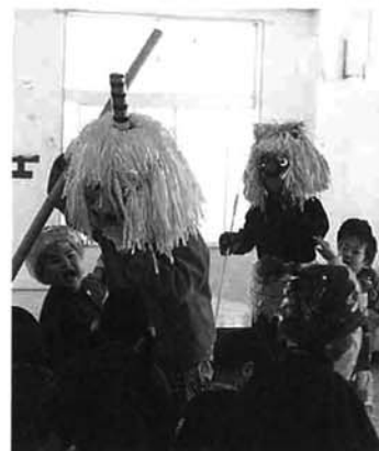
保母がふんする、二匹の鬼をめぐりて豆をまく園児

暴れん坊の鬼が怖くて、未満児のなかには保母の腕の中で泣く子もいた中央保育所の豆まき。四十七人の園児は、大きな声で「鬼は外! 福は内!」と豆をまき、みごとに赤鬼と青鬼を退治しました。