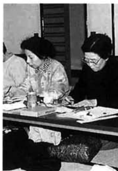
俳句会場のようす