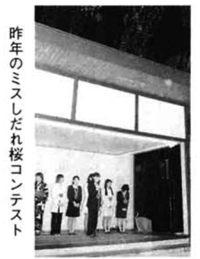
昨年のミスしだれ桜コンテスト

日時▶ 4月9日(金) 午後1時30分～3時 会場▶ 保健福祉センター(新栄町2-2-23) 問合せ▶ 長岡保健所 ☎33-4931