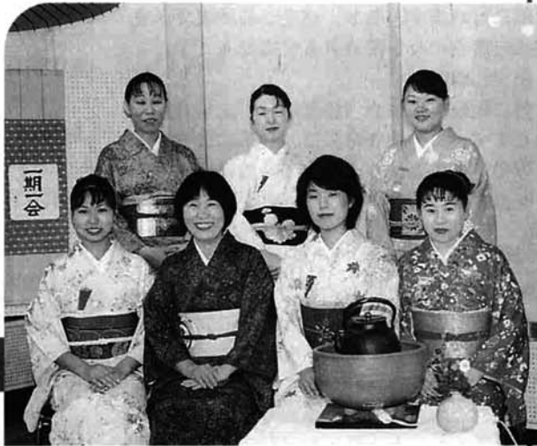
紅葉祭で活躍した 裏千家の受講生のみなさん