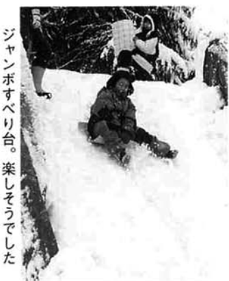
ジャンボすべり台。楽しそうでした

今年のイベントは、昨年から始まった城山の陣をはじめ、犬ぞり試乗体験、宝さがし、ジャンボすべり台、とちおのいいもの宝物写真展など盛りだくさん。城山の陣の参加者は、新城主めざし中央公園から城山本丸までを往復する難コースに挑戦し