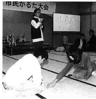
緊張感あふれる会場