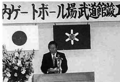
竣工式であいさつする杵淵市長