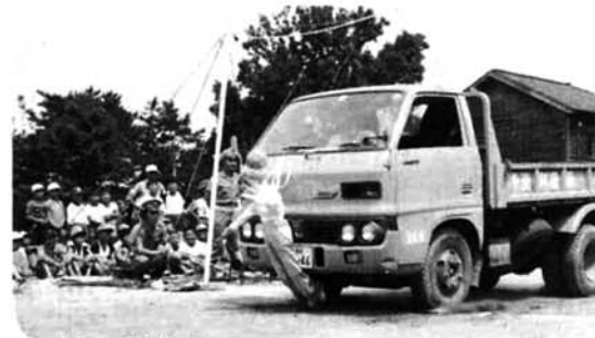
ダミー人形による衝突実験

県下の全市町村で、各種交通安全対策を推進し、住民の交通安全意識の高揚と交通事故防止を図る