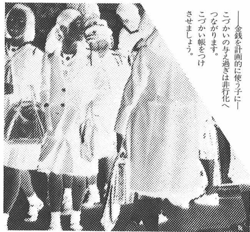
――金銭を計画的に使う子にこづかいの与え過ぎは非行化へつながります。こづかい帳をつけさせましょう。