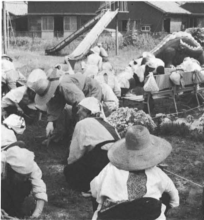
老人ホームによる児童遊園地の清掃