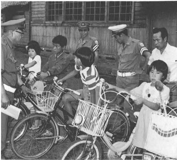
▲まず、自分のからだにあった自転車を…

夏休みを楽しく安全に過ごし、元気に二学期を迎えることができるようにと、寺泊小学校児童を対象に自転車安全運転教室を開催しました。子供を交通事故から守るために、お母さん方は次の点に十分注意してください。★子供は、一つのことに熱中すると周り