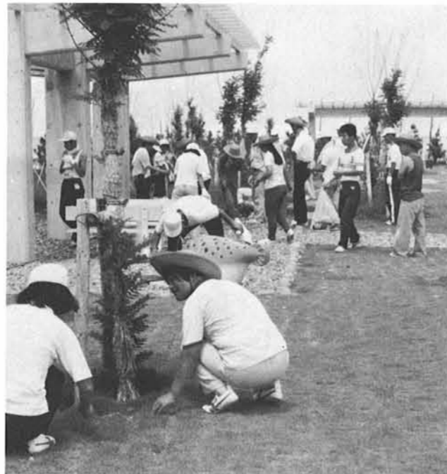
コロニー生徒による海浜公園の清掃

夕焼けの沈む海を浜風にふかれながら、のんびりと散歩を、とても気持ちの良いものです。ところが最近では、町や公園を歩いていてやたらと目につくのが紙クズ、ジュース等の空き缶……。これではとても気持ちの良い散歩など楽しめるものではありません。自分の家へ他人が勝手に上がりこんで紙クズ、空き缶などを捨てられたらあなたはどんな気持ちですか。 それと同じなのです。 これは、夏季における観光客のマナーの悪さが、ほとんどと言っても過言ではありません。町も、公園も、海も、みんな私達のものです。まず私達地域住民が模範を示してやりましょう。