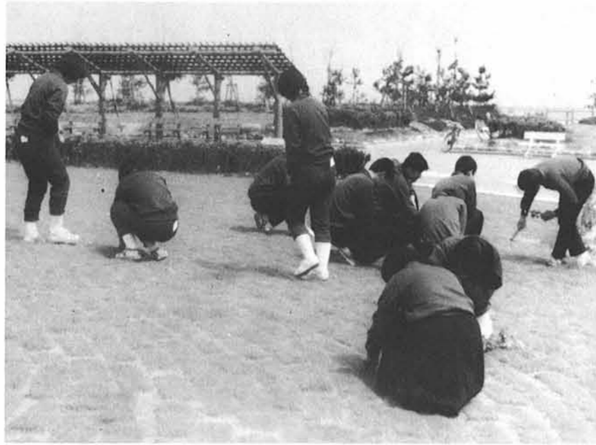
巻農高生徒による海浜公園の清掃