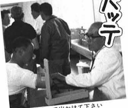
▲「体調十分」で出かけて下さい

共同作業で町体育館、野積集会所を会場に出かせぎ者全員を対象とした十数種にも及ぶ健康診断を実施しました。検査の結果異状の発見された約八十名の方々にはさらに精密検査を受けてもらうなど、出かせぎ前に「完全」な体調にしてい、安心して働きに行ってもらおうと