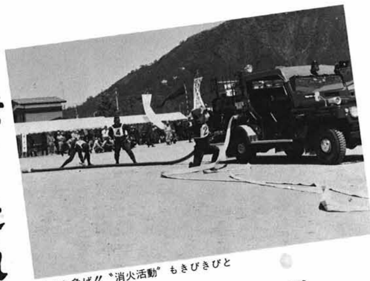
▲それ急げ!! “消火活動”もきびきびと