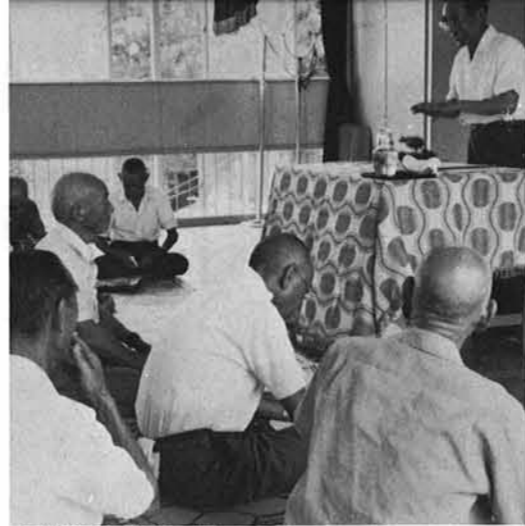
▲明治青年講座のひとこま