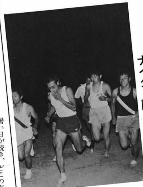
▲1500Mに挑戦する選手たち

町陸上競技協会と公民館の主催でおこなわれた第二回ナイター陸上競技記録会が、「真夏日」の続いた八月十二日に海浜グラウンドで開かれ、集まった約百二十人の人達は暑さにも負けず各種目ごとに別れ「記録」に挑戦していました。 この記録会は、寺泊町に住んでいる小中学生から青壮年にいたるまでの広い世代を対象に体力アップ、夏バテをフツ飛ばそうと開かれたもので、参加したひと全員に記録証が渡され、次の記録会までには何んとかこの記録を伸ばそうと、今からハリキッていました。 ために汚されているのを見かねて毎朝六時からゴミ拾いをおこない附近の人達にたいへん喜ばれました。