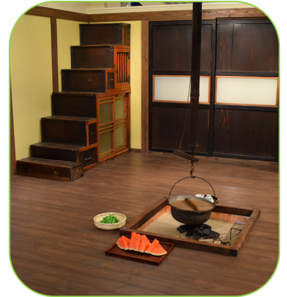
▲家族のいた囲炉裏 (寺泊民俗資料館)

「トキみ〜て」の観覧料は100円(中学生以下無料)、「トキと自然の学習館」「寺泊民俗資料館」は無料で見学できます。トキみ〜てのオープンにより今後、佐渡との連携が強化され、寺泊への観光客の増加が期待されています。