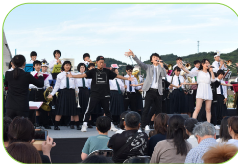
▲「故郷はひとつ」のスペシャルバージョン