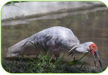
▲餌のドジョウをついばむトキ