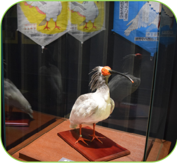
▲標本などでトキについて 楽しく学べる(学習館)

トキの一般公開が始まった観覧棟「トキみ〜て」では、飼育しているトキを大きな窓から最短2mの距離で観察することができます。