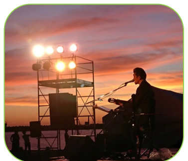
▲宇崎竜童ソロライブ