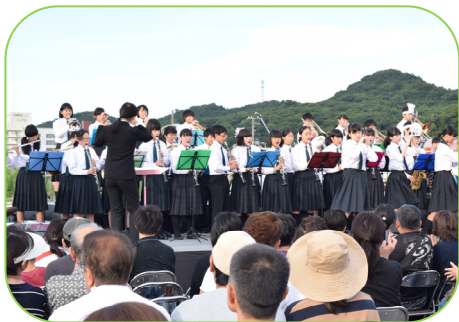
▲寺泊中学校吹奏楽部の演奏