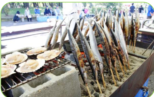
▲旬のサンマの塩焼きと殻付きホタテ焼き

10月12日(日)、みなと公園で「農と魚のフェスティバル in 寺泊」が開催されました。 地元で水揚げされた鮮魚のセリ市や農産物の販売、餅つきや宝探し、ステージイベントが華を添え、訪れた人たちは寺泊の秋を満喫した一日でした。