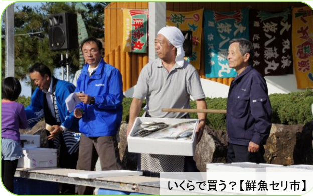
いくらで買う?【鮮魚セリ市】