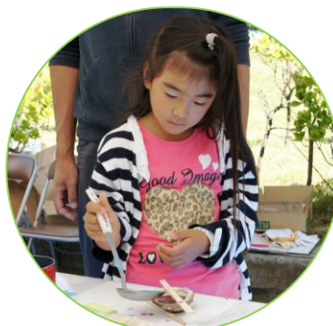
▲貝殻でキャンドル作り