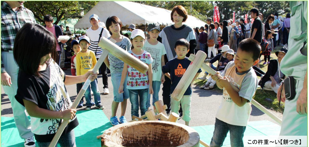
この杵重〜い【餅つき】