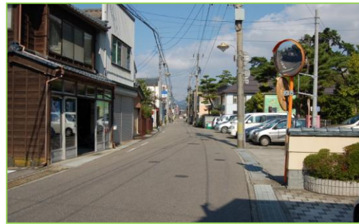
▲「寺泊の海・寺泊歴史街道」