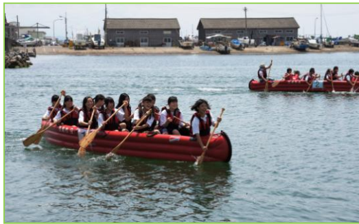
▲「寺泊の海・海洋資源」

寺泊地域の宝として決定した「寺泊の海・海洋資源」と「寺泊の海・寺泊歴史街道」について、具体的な磨き上げの事業を検討しました。