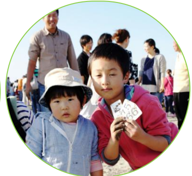
▲宝探しでお宝ゲット