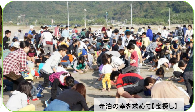
寺泊の幸を求めて【宝探し】

10月12日(日)、みなと公園で「農と魚のフェスティバル in 寺泊」が開催されました。 地元で水揚げされた鮮魚のセリ市や農産物の販売、餅つきや宝探し、ステージイベントが華を添え、訪れた人たちは寺泊の秋を満喫した一日でした。