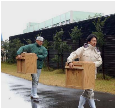
▲木箱に入れてトキを移送

トキと自然の学習館では、ヒナの成長を撮影した動画や飼育ケージ内のライブ映像を大画面で見ることができます。ぜひ、お越しください。（繁殖時期などライブ映像を見ることができない場合があります。）