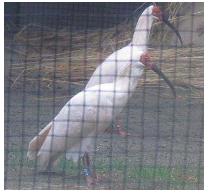
▲新たに受け入れたトキのペア