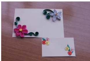
◀ ペーパークイリングのメッセージカード