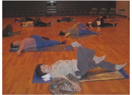
▲「運動を愉しむ会」(全3回)

また、2月9日には「きれいを作るレシピ」が開催され、ピラティス・ストレッチに挑戦。体の核を整えて、きれいな姿勢を保つための体操をしました。