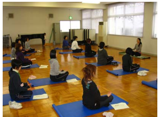
▲「きれいを作るレシピ」(全5回)