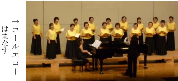
→ コールエコー はまなす