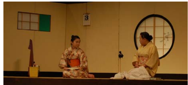
← 演劇に寄り道 するかい？