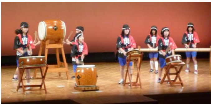
← 大河津小学校 若竹太鼓クラブ