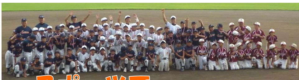
↑寺泊マリンスターズ：準優勝

試合を通して友情を深め、お別れの際には「また会おう」と握手したり手を振ったりする子どもたち。かけがえない思い出ができたようです。