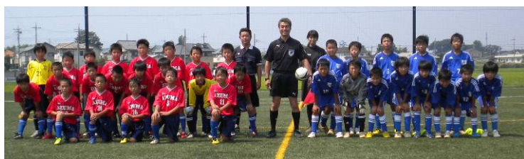
↑寺泊少年サッカークラブ：準優勝