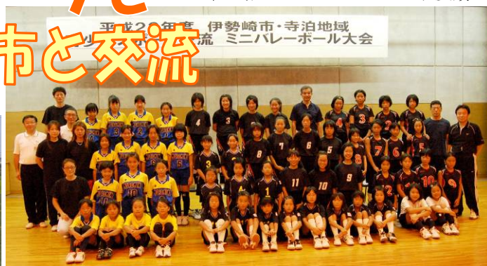
↑寺泊ジュニアバレーボールクラブ：準優勝