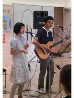
↑「かめもなか」出演の様子(8月)