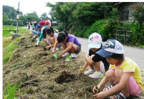
↑苗植えの様子。子どもたちが心を込めて丁寧に植えました。(7月3日)

コスモスの活動は今年で4年目。美しい景観づくりのため、子ども会も一緒になって、地域ぐるみで取り組んでいます。