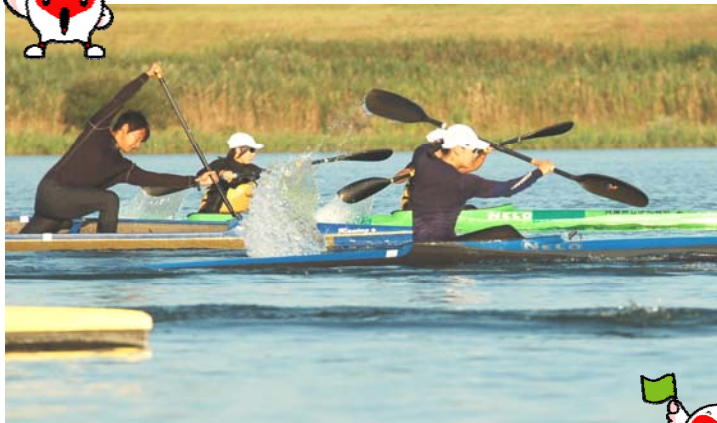
▲本番を直前に選手の皆さん。練習にも力が入ります