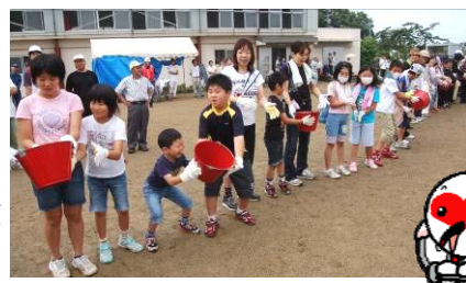
▶初期消火訓練でのバケツリレー