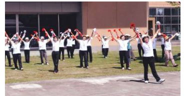
▲栃尾地域で行われた市民心身健康づくり(5月29日)