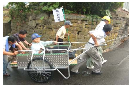
▲リアカーでの要援護者搬送訓練