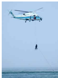
▲ヘリコプターによる救助訓練

7月5日、上荒町から磯町までの海岸周辺の地区で、地震による津波を想定した訓練を行いました。訓練ではまず、各町内の一次避難所から寺泊小学校へ避難し、その後、寺泊小学校で初期消火訓練や避難所運営訓練などの各種訓練を実施。また中央海水浴場ではヘリコプターによる救助訓練などを行い、それぞれ災害時の動きを再確認しました。