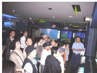
水族博物館（職員より説明）

10月8日（日）、北極海に生息するクリオネの見学、ゆでたてのカニの試食、史跡にまつわる紙芝居と史跡めぐりの旅が開催されました。