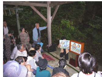
妻戸神社にて紙芝居