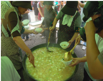
地元漁師による食のふるまい

寺泊地域のふるさと創生基金事業として、寺泊地域が「海」という地域資源を活かしたまちづくりを進めるために、海に親しみ、海を知る体験型イベントを通して、市民交流を深め、寺泊の魅力を内外にアピールするために開催したものです。