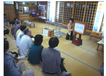
白山媛神社にて紙芝居