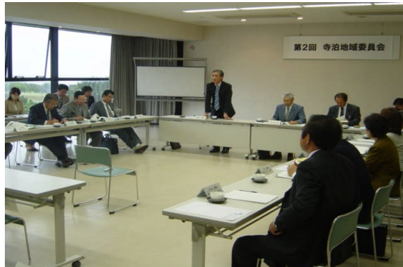
平成18年度 第2回地域委員会

5/24(水)寺泊文化センターで、第2回寺泊地域委員会が開催されました。委員会では「長岡市地域コミュニティ事業補助金」交付団体の審査と「長岡市総合計画」寺泊地域の展望についての意見交換が行われました。地域展望については、次回の委員会でも継続審議されます。