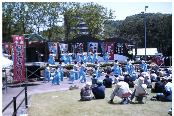
よさこい踊り (みなと公園会場)