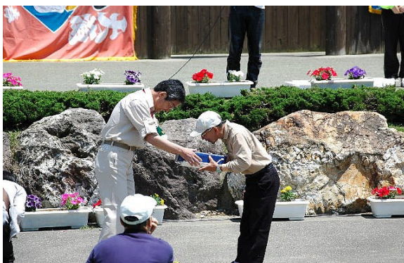
クイズ正解者にプレゼント