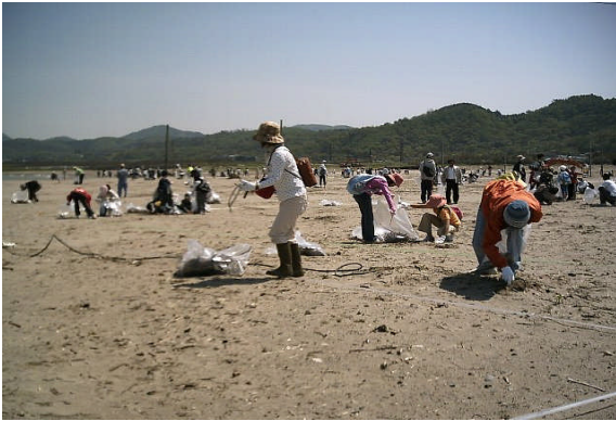
清掃作業の様子 (中央海岸)