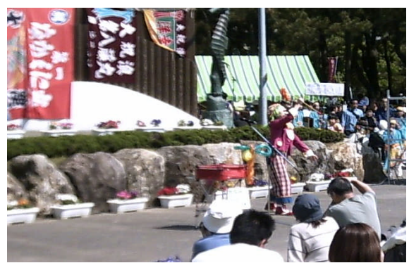
風船ヒーロショー