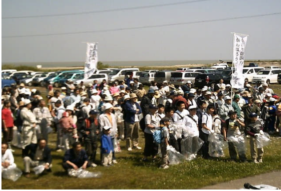
ボランティア清掃の皆さん

好天に恵まれた 5 月 21 日(日)、2 万人の皆さんがイベントを楽しみました!!