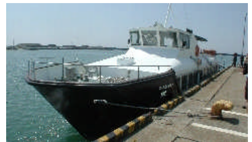
試乗会での「ぼーとあいらんど号」

4/29(土)から、寺泊港と越後七浦を周遊する遊覧船「ぼーとあいらんど号」が運航を開始しました。11月12日まで火曜日を除く毎日運航。船上から美しい海岸線を望むことができます。日中5便(サンセットクルーズも有)、ご家族やお仲間でお出掛けになってみては。