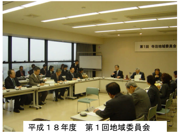
平成18年度 第1回地域委員会

4/20(木)寺泊文化センターで、第1回寺泊地域委員会が開催されました。委員会では、「長岡市総合計画」の策定についての説明が長岡市役所企画課からされました。 また、「寺泊支所の移転計画」について、地域委員の皆さんの意見を伺いました。