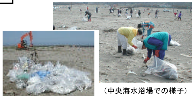
(中央海水浴場での様子)

4/23(日)に実施しました海岸清掃には、皆さんのあたたかい御理解と御協力、大変ありがとうございました。 おかげ様で、4+ダンフ34台、20+のゴミを回収することができました。