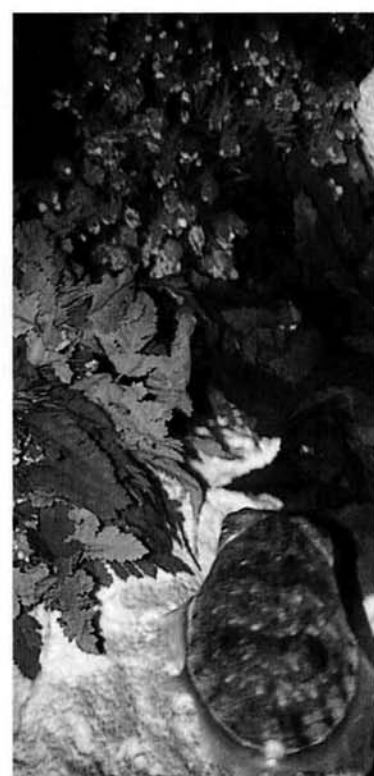
卵と親のコウイカ

たかれコウイカが驚いて墨を吐かないようにするために二重のガラスにしたり、弱ってくるとイカの甲による浮力調整ができず浮いてしまい、普段しまい込んでいる餌をつかまえる長い2本の触腕をだらしと出してしまいます。そうなると思袋の筋肉もゆるんでしまい、墨を出してしまいま