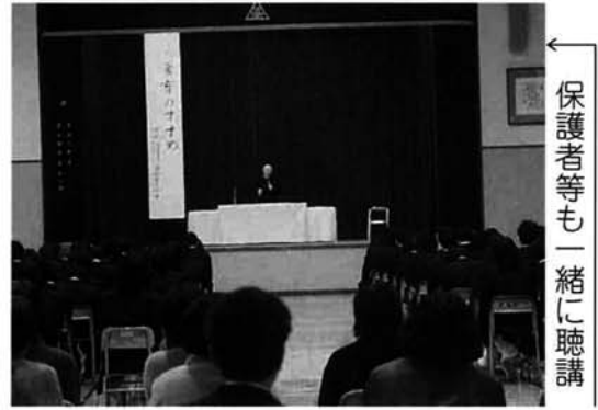
保護者等も一緒に聴講

新しい世紀を迎えましたが、新春から忍耐力不足などに起因する若者の言動が報じられ、教育に携わる者として、重い責任を感じます。 本校では、思いやりの心に満ち、豊かな感性や倫理観を具え、苦しく嫌なことからも目を背けず、個性的に逞しく生き、自分の生き方や進路を主体的に創造してゆける能力を養うために、沢山の心豊かな体験の機会を提供し、考えさせるチャレンジ21教育推進運動に、昨年度から取り組んでいます。今回は、その企画の中から、学校見学会と講