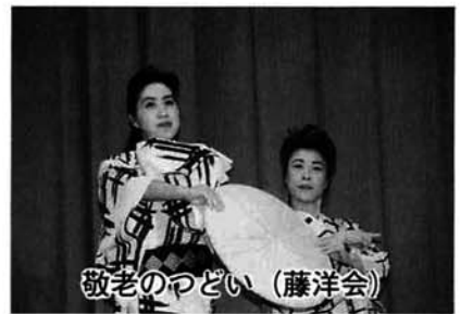
敬老のつどい (藤洋会)