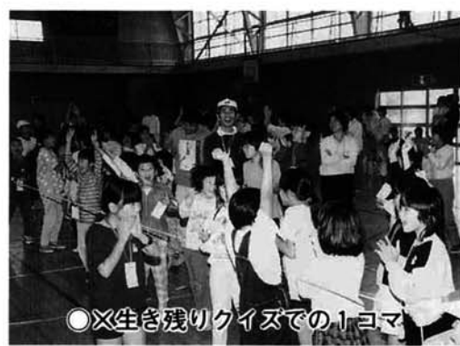
○×生き残りクイズでの1コマ