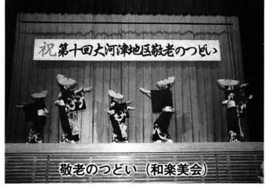
敬老のつどい (和楽美会)

つどいの当日は、肌寒く、秋雨の降るあいにくの天候ではありましたが、ホールの中は活気があふれ、汗ばむ程の