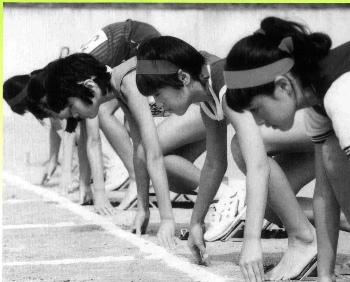
緊張の一瞬 (小学校親善陸上競技大会)