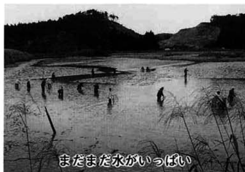
まだまだ水がいっぱい