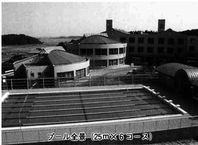
プール全景 (25m×6コース)

去る6月27日に請負契約された寺泊中学校屋外プールがこの度完成し、学校中庭にその堂々とした姿を現しました。