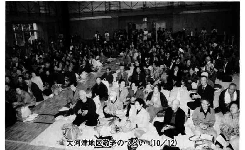
大河津地区敬老のつどい (10/12)