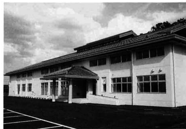
農村環境改善センター全景