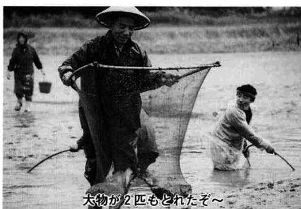
大物が2匹もどれたぞ～