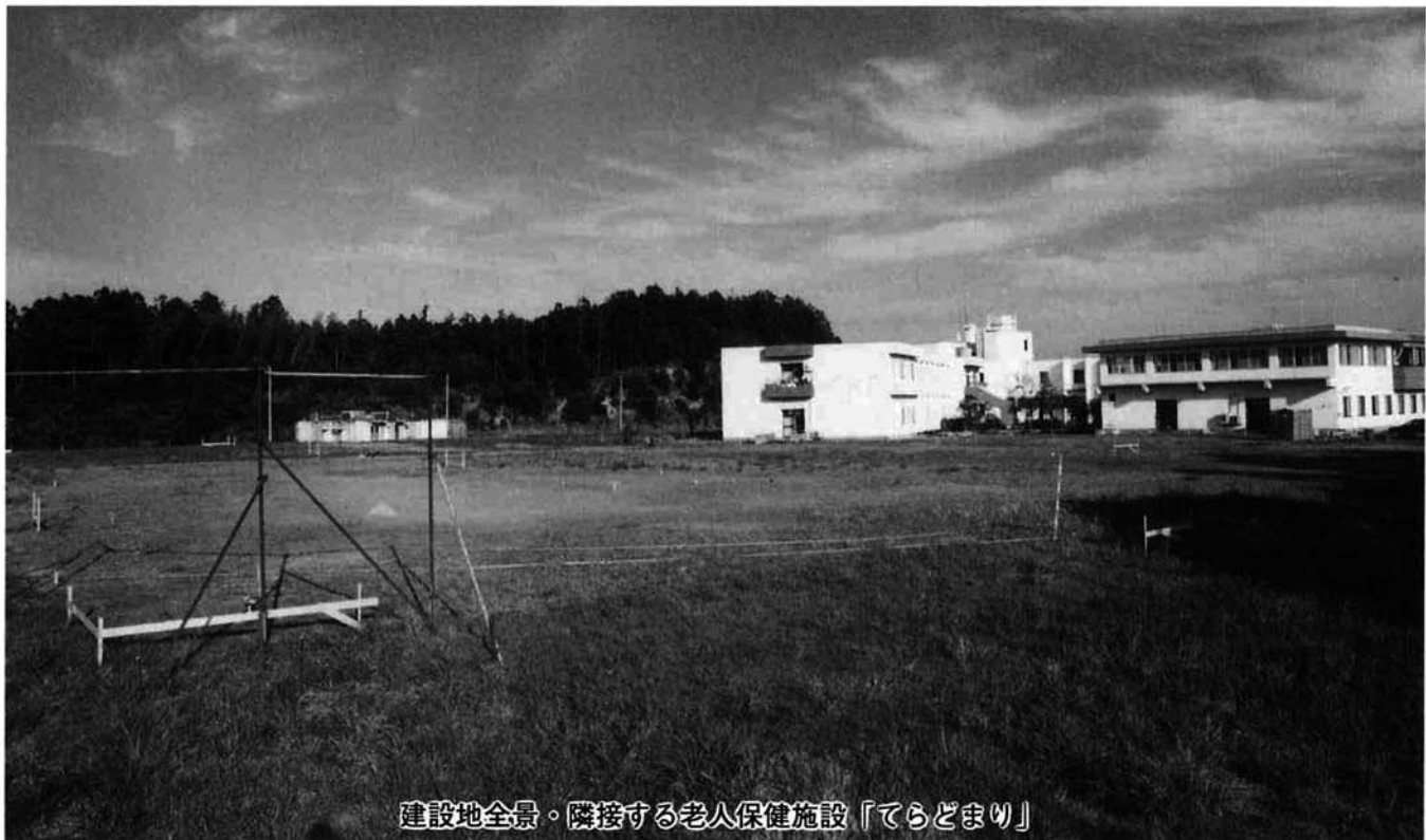
建設地全景。隣接する老人保健施設「てらどまり」

特別養護老人ホームとは、65歳以上の方が、身体上又は精神上著しい障害があるため、常時介護を必要とするが、家庭で介護を受けることが困難な方が入所でき、日常生活上必要な介護が受けられる施設であり、寺泊町には大勢の方が入所を待ち望んでいます。着工された(仮称)特別養護老人ホーム「寺泊」は、国・県の補助金を受け、社会福祉法人・長岡三古老人福祉会が事業主体となって建設されるものであり、長岡市、寺泊町を含めた三島郡内の6町村、分水町の計8市町村が経費の一部を補助しています。定員60名の一般入所(寺泊町の入所枠12名)、10名の短期入所のほか、寺泊町が単独で経費の一部を補助し、寺泊町の在宅虚弱老人及び寝たきり老人等に対し、通所または訪問により入浴、給食、機能訓練などのサービスを提供する、定員8名の老人デイサービスセンターが合築されます。建物は鉄筋コンクリート造り二階建てで延べ床面積3,592.3㎡(特別養護老人ホームⅡ3,354.4㎡、老人デイサービスセンターⅡ237.9㎡)で、下桐地内の老人保健施設「てらどまり」に隣接(旧国療跡地)して建設されるものです。工事期間中の無事故と、一日も早い計画どおりの立派な完成を願いたいものです。