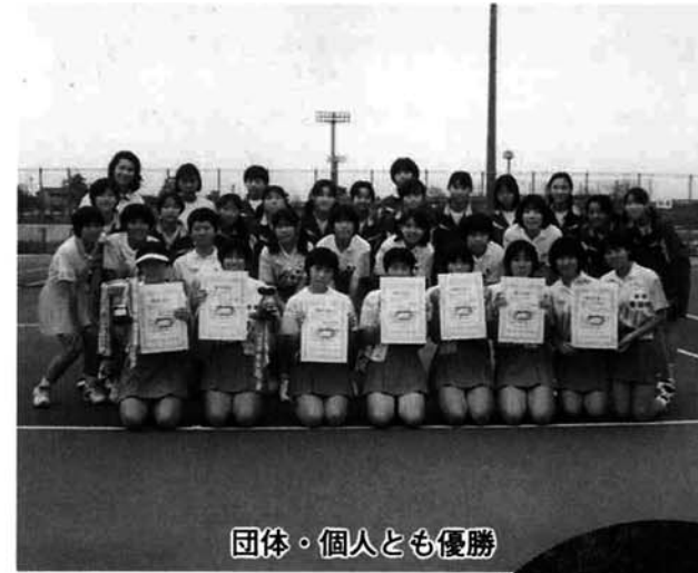
団体・個人とも優勝

三島郡中学校球技大会新人戦が、去る10月2日、3日の両日、各種目ごとに郡内各中学校を会場に開催されました。寺泊中学校は10種目中4種目が優勝。一種目が2位と輝かしい成績を納めました。 開校の忙しさの中で、クラブ活動の成績はもう一歩でしたが、指導者の努力と、生徒たちのやる気が今回のすばらしい成績につながりました。 懸命に技と力を競い合った想い出に残る新人大会。寺中選手の大健闘に拍手。