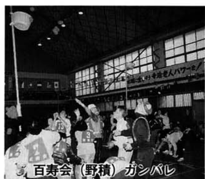
百寿会(野積) ガンバレ