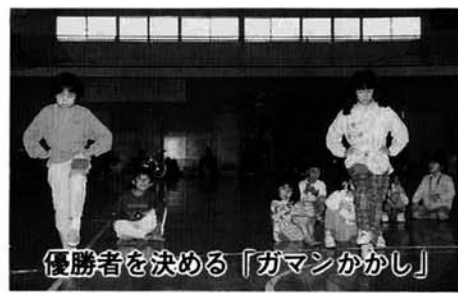
優勝者を決める「ガマンかかし」