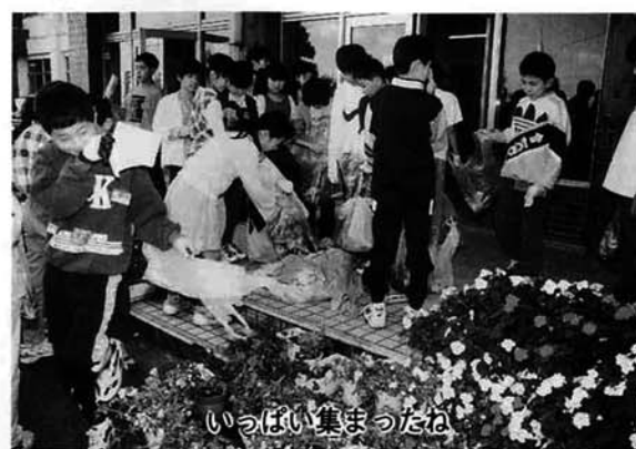
いっぱい集まったね