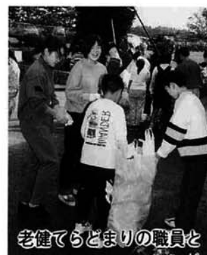
老健でらどまりの職員と

他、悪臭のするゴミもありましたが、気にせず袋いっぱい拾っていました。 集まったゴミを体育館に集めての閉会式。校長先生からは「みんなの力のおかげで、たいへんきれいになりました。これからは、空き缶やゴミを捨てない心のクリーン作戦を行いましょう」とお話がありました。