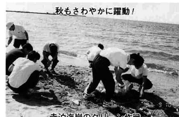
秋もさわやかに躍動!