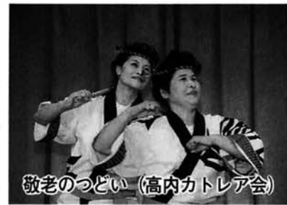
敬老のつどい (高内カトリア会)