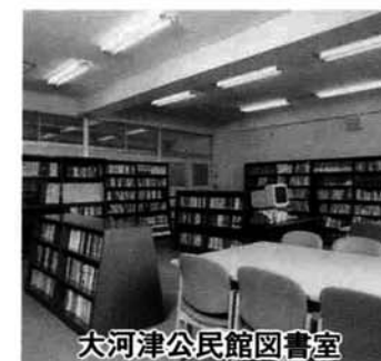
大河津公民館図書室