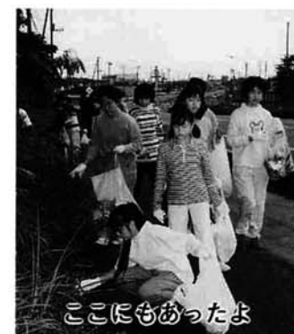
ここにもあったよ