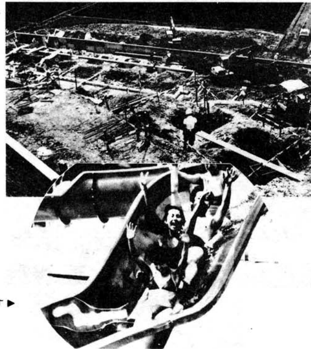
こんなのができます▶

延命寺ヶ原森林公園に8月オープンをめざして、ウォータースライダーと遊泳用プールの建設が急ピッチで進んでいます。場所はSL駅前駐車場のすぐ下。斜面に配管したU字形の水路の中に水を流し、流れに乗って豪快に滑りおりるウォータースライダー。全長91mと68mの2本。下には30m×13m深さ0.5~1.0mの遊泳用プールがつくれます。