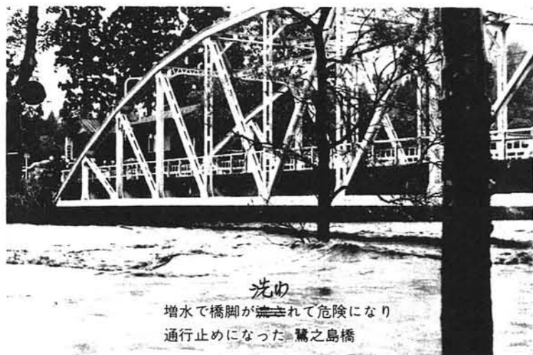
増水で橋脚が 崩 れて危険になり 通行止めになった 鷺之島橋