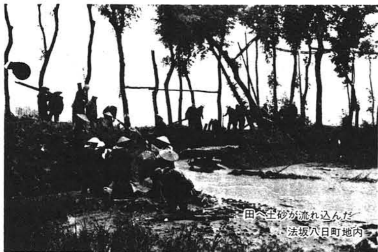
田へ土砂が流れ込んだ 法坂八日町地内