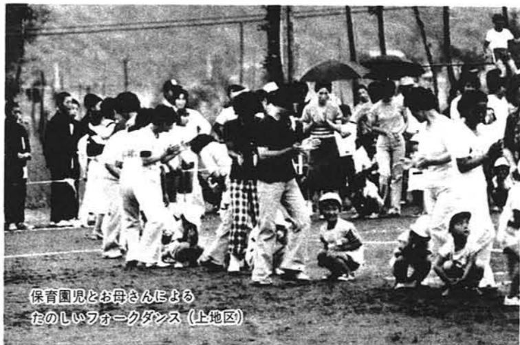
保育園児とお母さんによる たのしいフォークダンス(上地区)