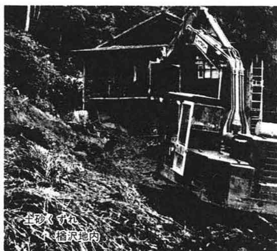
土砂くずれ 橋沢地内