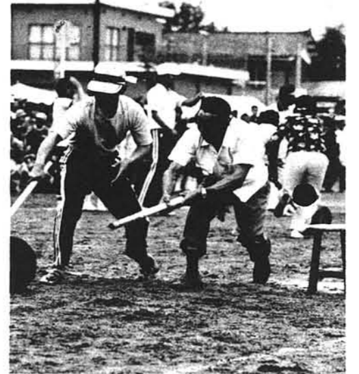
今年新しい種目 タルころがしリレー(中地区)