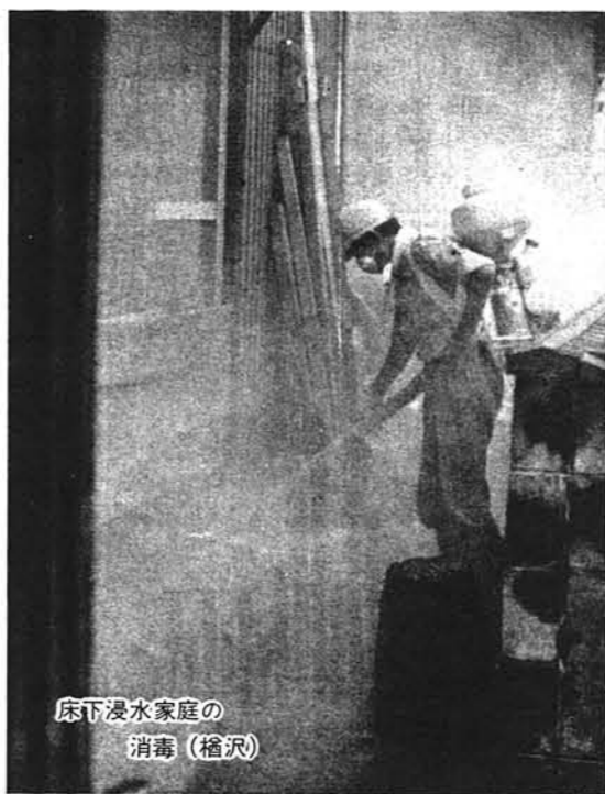
床下浸水家庭の 消毒(橋沢)