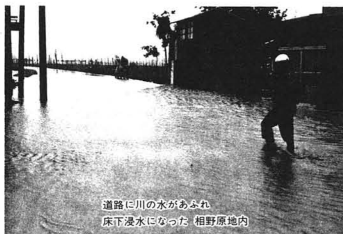
道路に川の水があふれ 床下浸水になった 相野原地内