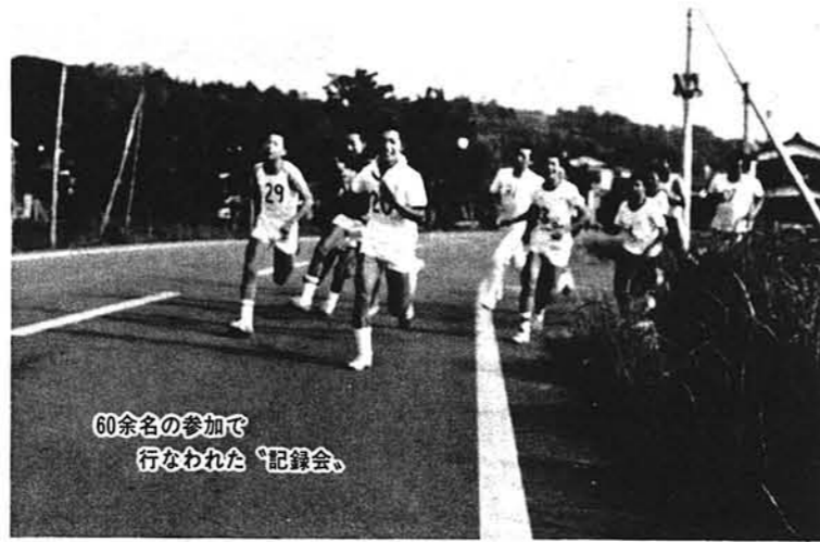
60余名の参加で 行なわれた「記録会」