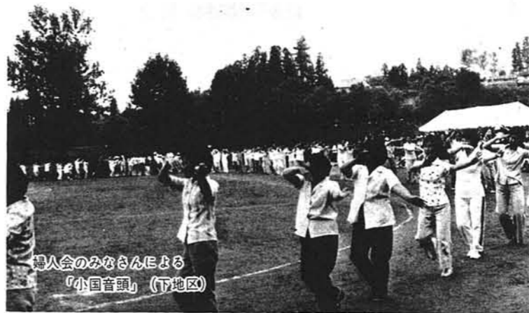
婦人会のみなさんによる 「小国音頭」(下地区)