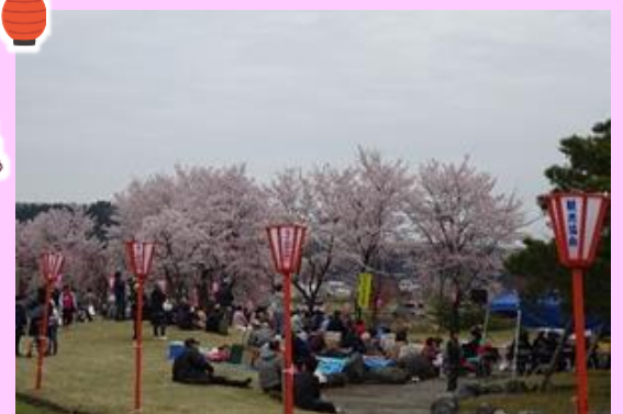
第10回おぐに桜まつりの様子