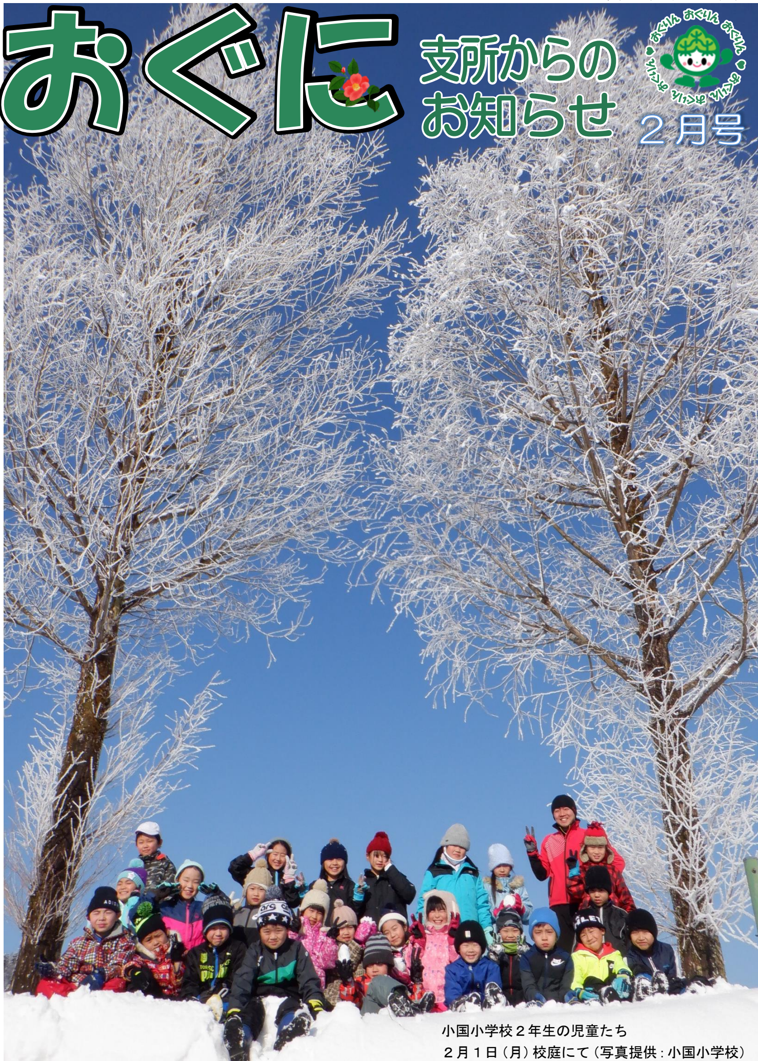
小国小学校2年生の児童たち 2月1日(月)校庭にて