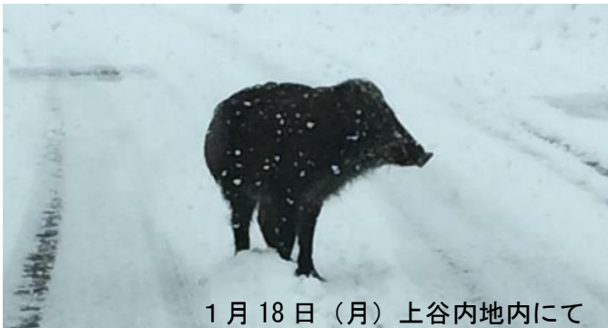
1月18日(月)上谷内地内にて