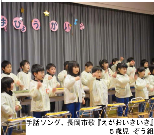
手話ソング、長岡市歌『えがおいきいき』 5歳児 ぞう組

11月19日(土)、ひまわり保育園で発表会が行われ、たくさんの方が見守る中、元気よく演技していました。