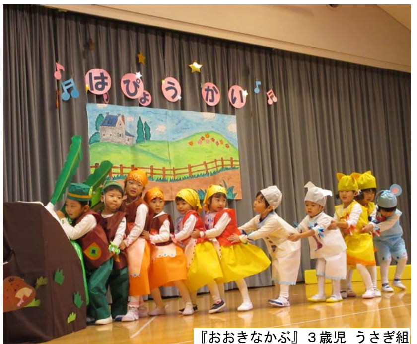
『おおきなかぶ』3歳児 うさぎ組