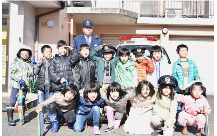
おまわりさんになりきって「はい、ポーズ♪」