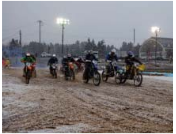
初のナイトレース