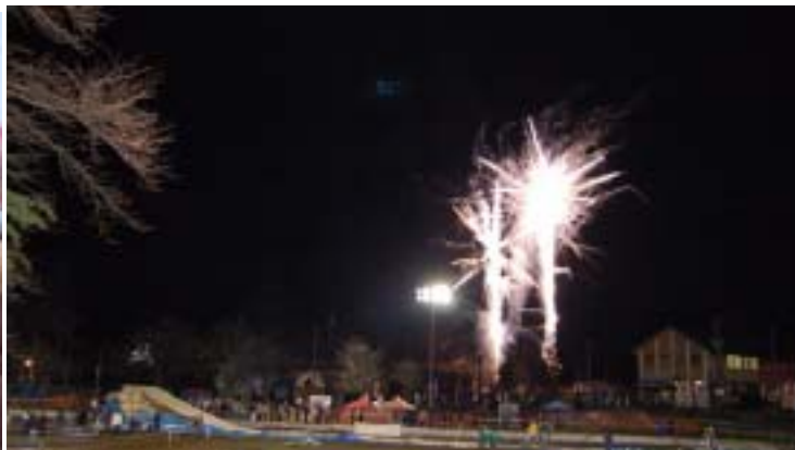
フェニックス花火