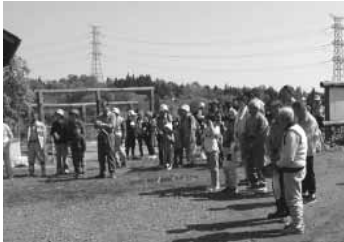
八石山 山開き (八王子集落)

小国町は、森林面積が全体の約65%を占めています。森林公園や八石山には、その自然を楽しむために多くの人々が訪れ賑わいをみせます。また、都会からイベントに訪れる人にも、各種行事とともに、緑豊かな自然がお迎えをします。