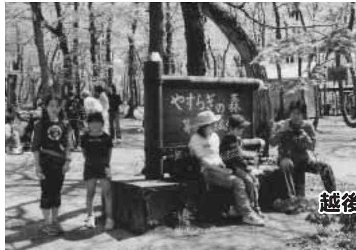
越後おぐに森林公園 (林間広間)

小国町は、森林面積が全体の約65%を占めています。森林公園や八石山には、その自然を楽しむために多くの人々が訪れ賑わいをみせます。また、都会からイベントに訪れる人にも、各種行事とともに、緑豊かな自然がお迎えをします。