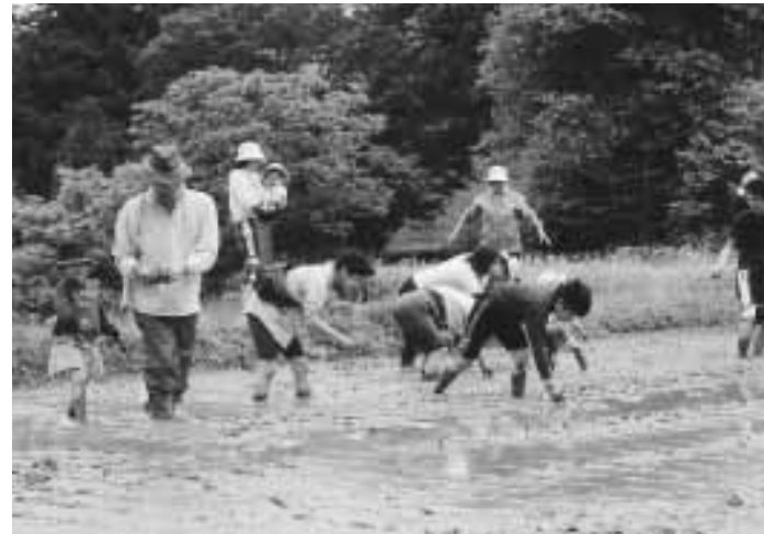
田植えツアー (法末集落)