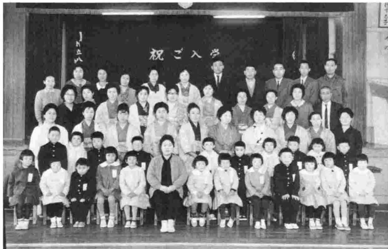
▲入学式の記念写真。昭和41年度。 (創立90周年の年です)

閉校して、早や二カ月になろうとしています。 「閉じる百年」も今回の中通小学校で最後。そこで、今回は角度を変え、写真で、中通小の歴史を見てみたいと思います。みなさんから、「ああー。こんな時もあったんだなあー」と昔を振り返ってもらうために、あえて、写真説明を簡単にしました。