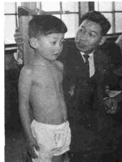
▲就学前健康診断です。昭和42年1月。