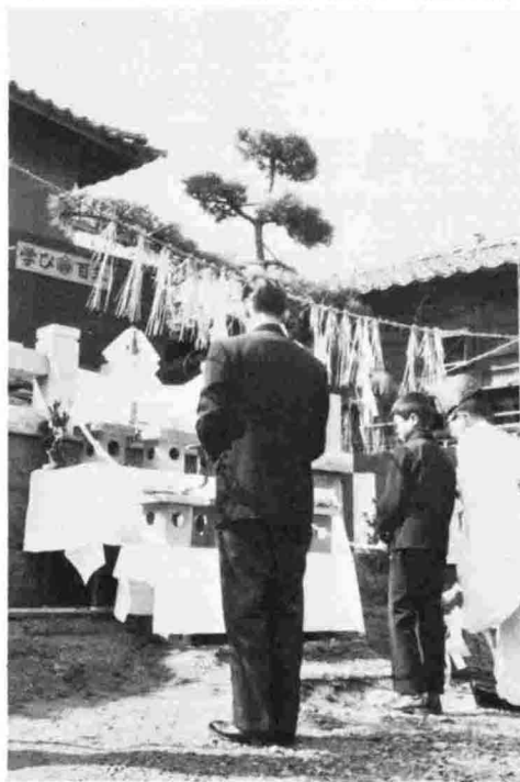
創立100周年記念式典の除幕式。昭和51年。