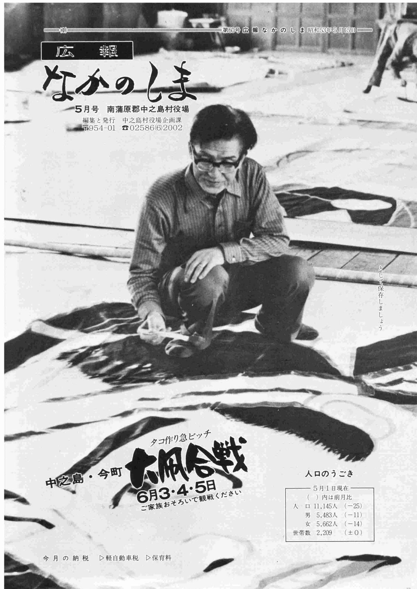
とじて保存しましょう

タコ作り急ピッチ 大風合戦 中之島・今町 6月3・4・5日 ご家族おそろいで観戦ください