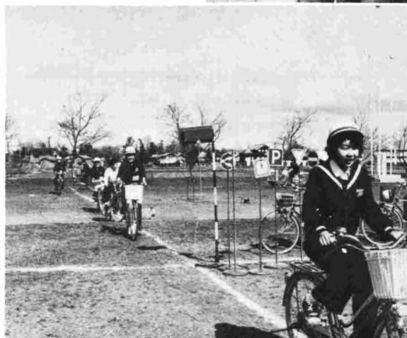
◀4月19日北中学校の新一年生(60名)を 対象に交通安全指導実施訓練