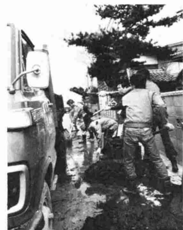
◀4月16日中之島で排水路清掃 ごくろうさまでした。