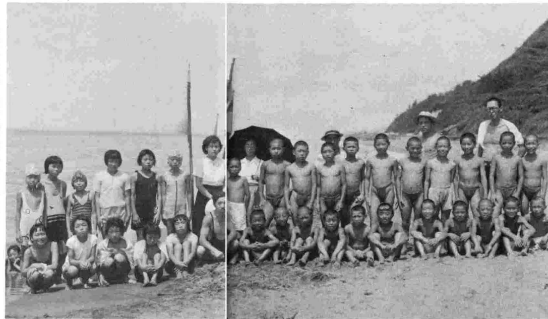
▶中通小の第1回臨海教育。昭和27年8月3日でした。