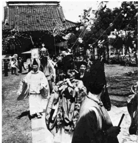
◀4月15日中条祭りのもよう