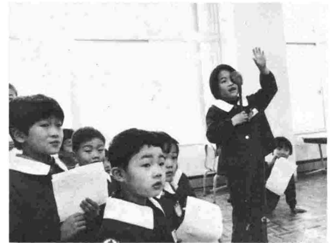
▲就学児童健康診断

今年4月新しく入学する児童は146名。学校別では中央小が98名、上通小26名、信条小22名となっています。12月19日、中央小では就学児童健康診断が行われ、初めて入る大きな学校に「うれしさと緊張」が入りまじっていました。