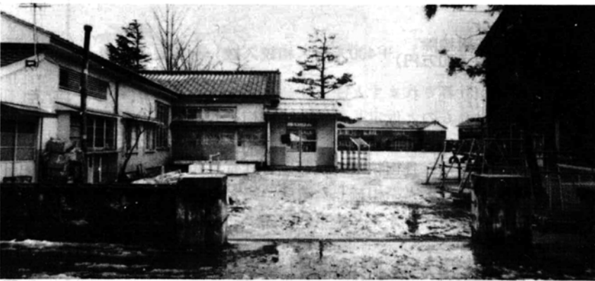
増設改築が行われる中之島保育所

中之島村の公金の出納事務の取扱について、中之島村農協を指定し六月一日から業務を取扱います。