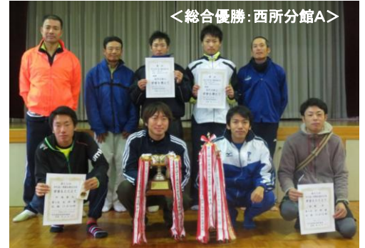
<総合優勝:西所分館A>