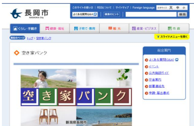
▲トップページ。物件は随時追加します。

空き家バンクでは、空き家を売りたい・貸したい人の物件情報をホームページ( http://www.city.nagaoka.niigata.jp/akiya/ )で紹介しています。