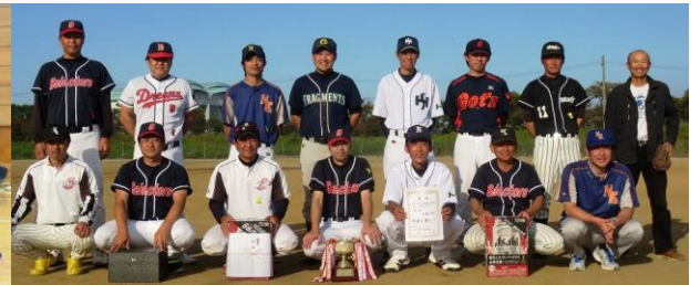
<野球優勝:上通分館>