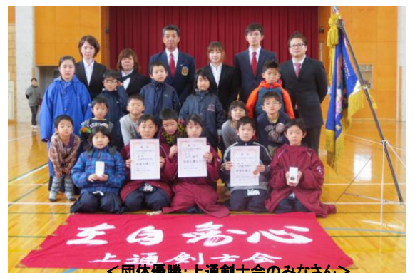
<団体優勝:上通剣士会のみなさん>