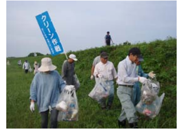
▲昨年のクリーン作戦のようす