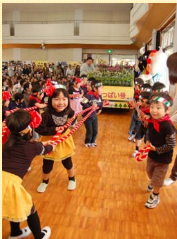
◀中之島保育園児による花車パレード

中之島公民館を会場に約 700 人が参加。中之島保育園児やすいれんによるアトラクションや、各団体による花植えの活動報告など地域の特性を活かし、花や草木にふれあえた一日でした。