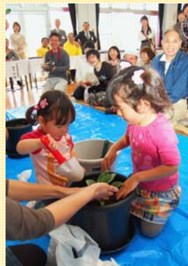
◀カラーの育て方を実演