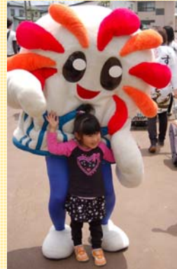
◀なっちゃんも会場に登場。子どもたちに大人気。