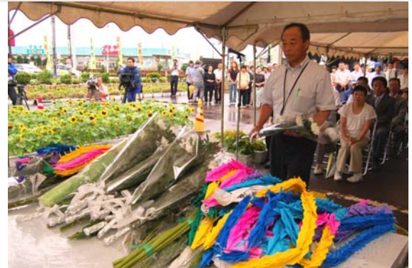
▲▼昨年のおようす(写真:上下)