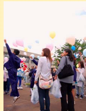
◀花の種とメッセージを付けた風船を空に放ちました。